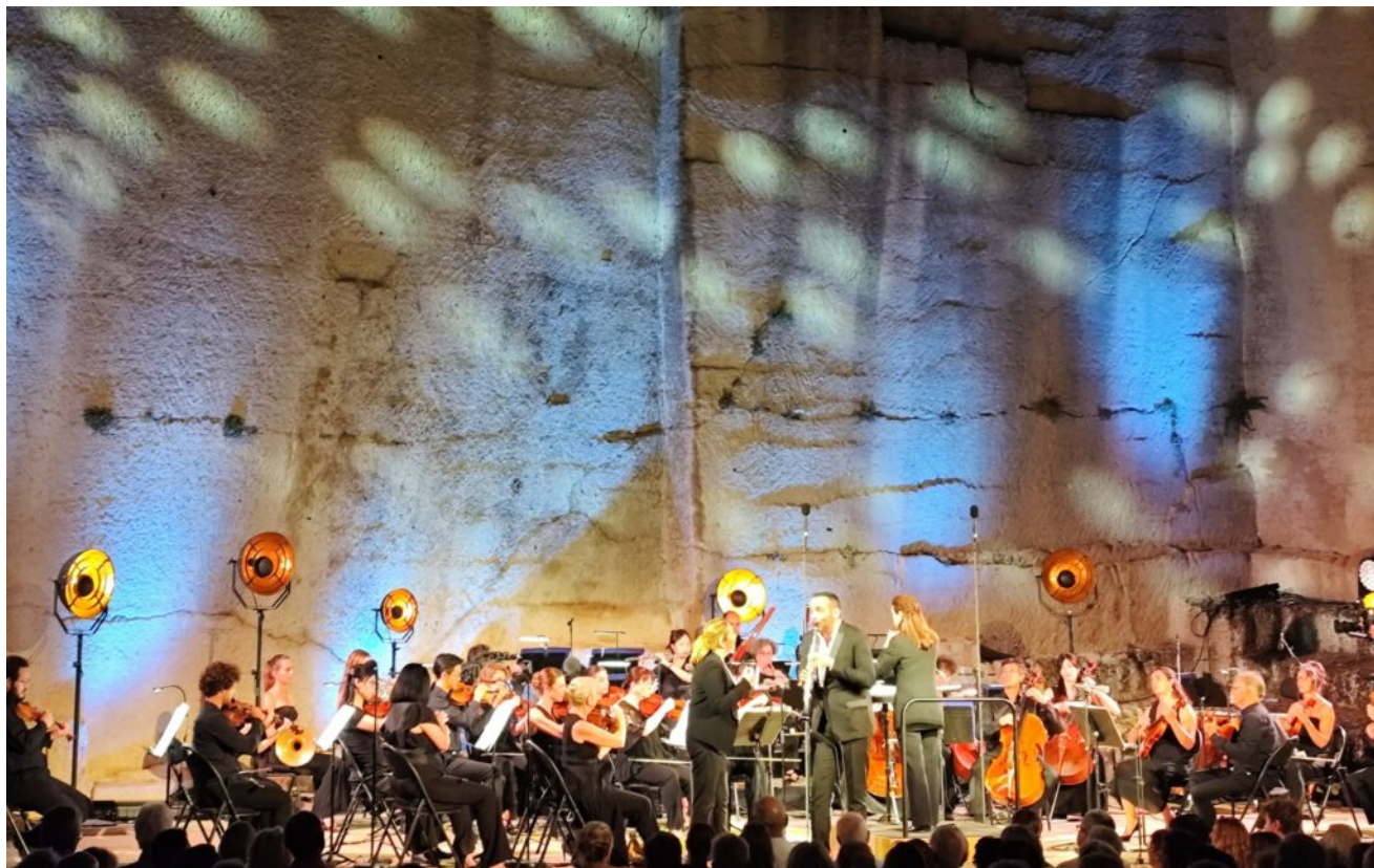
L'Orchestre national Avignon-Provence en concert aux Taillades.