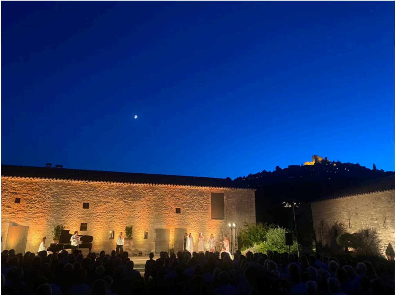
La Maison Basse de SCAD Lacoste accueille régulièrement des concerts.

qu'il faut posséder certaines connaissances pour écouter et apprécier la musique classique. Une tendance que les Musicales du Luberon veulent effacer.