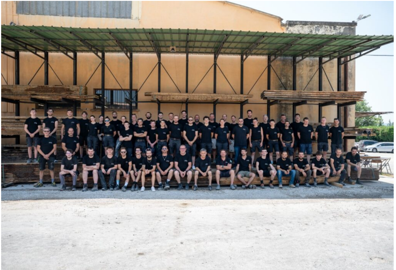
L'équipe de Gargas.