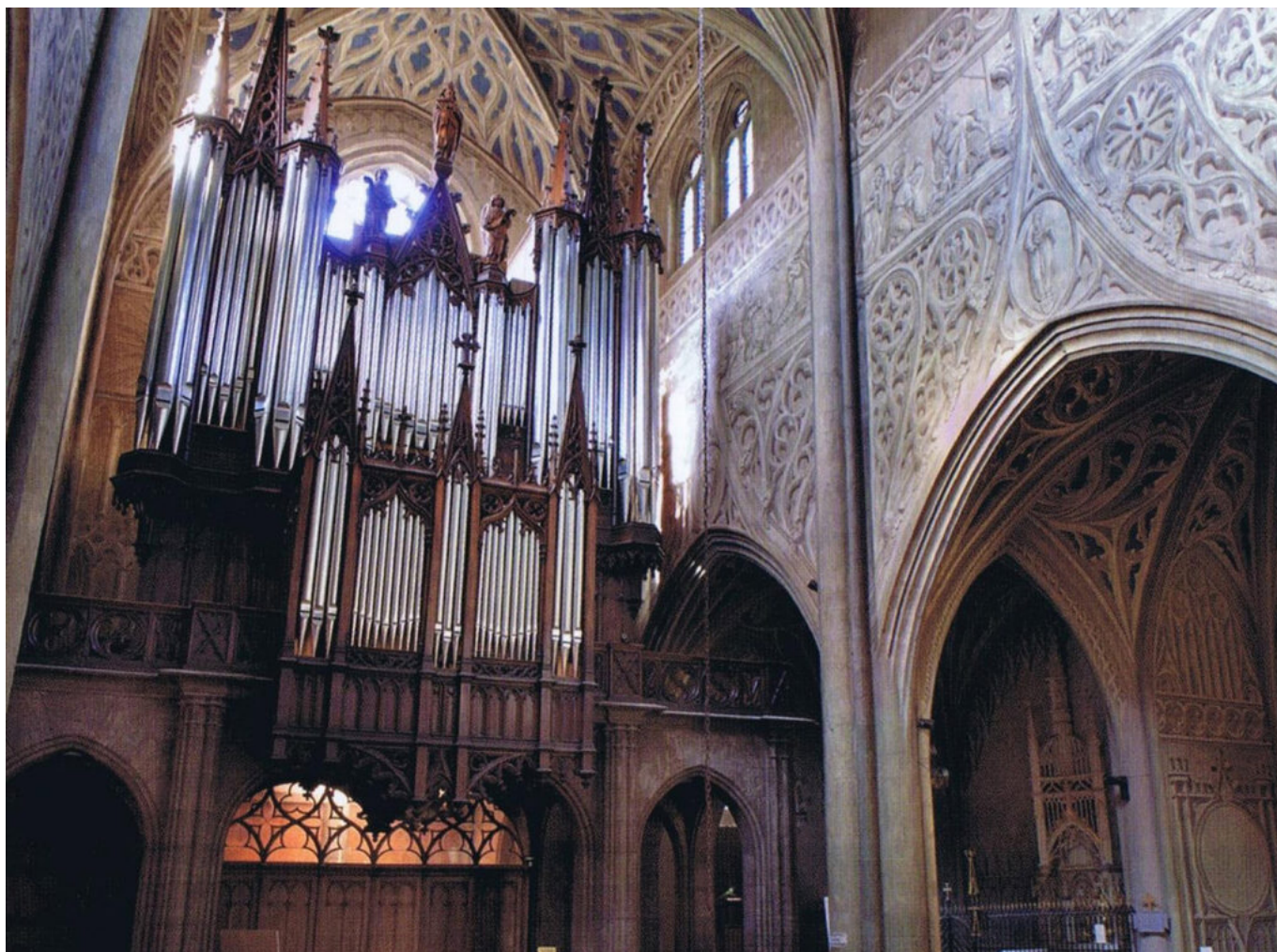
Cathédrale de Chambéry