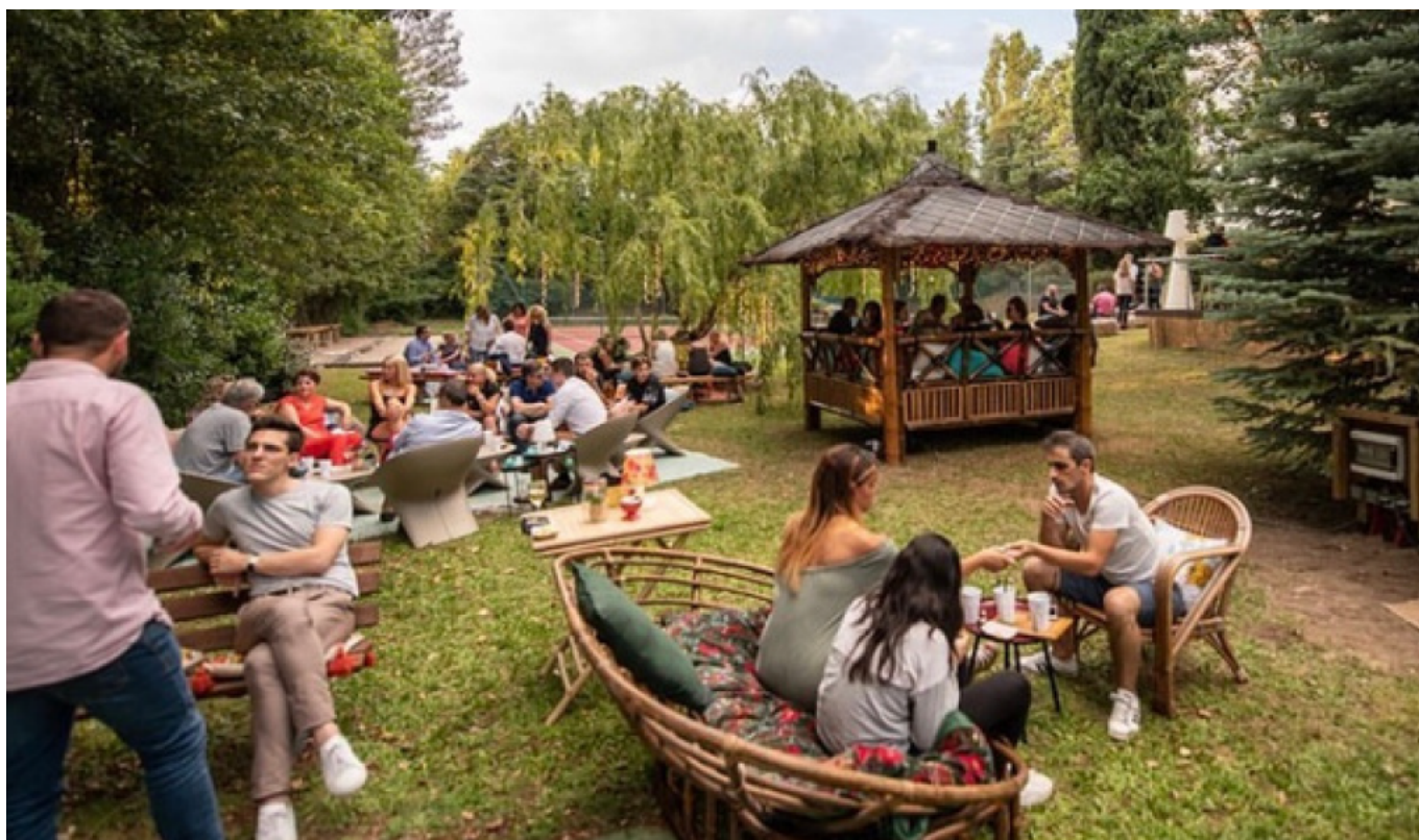
Pause rafraîchissement avant ou après le spectacle