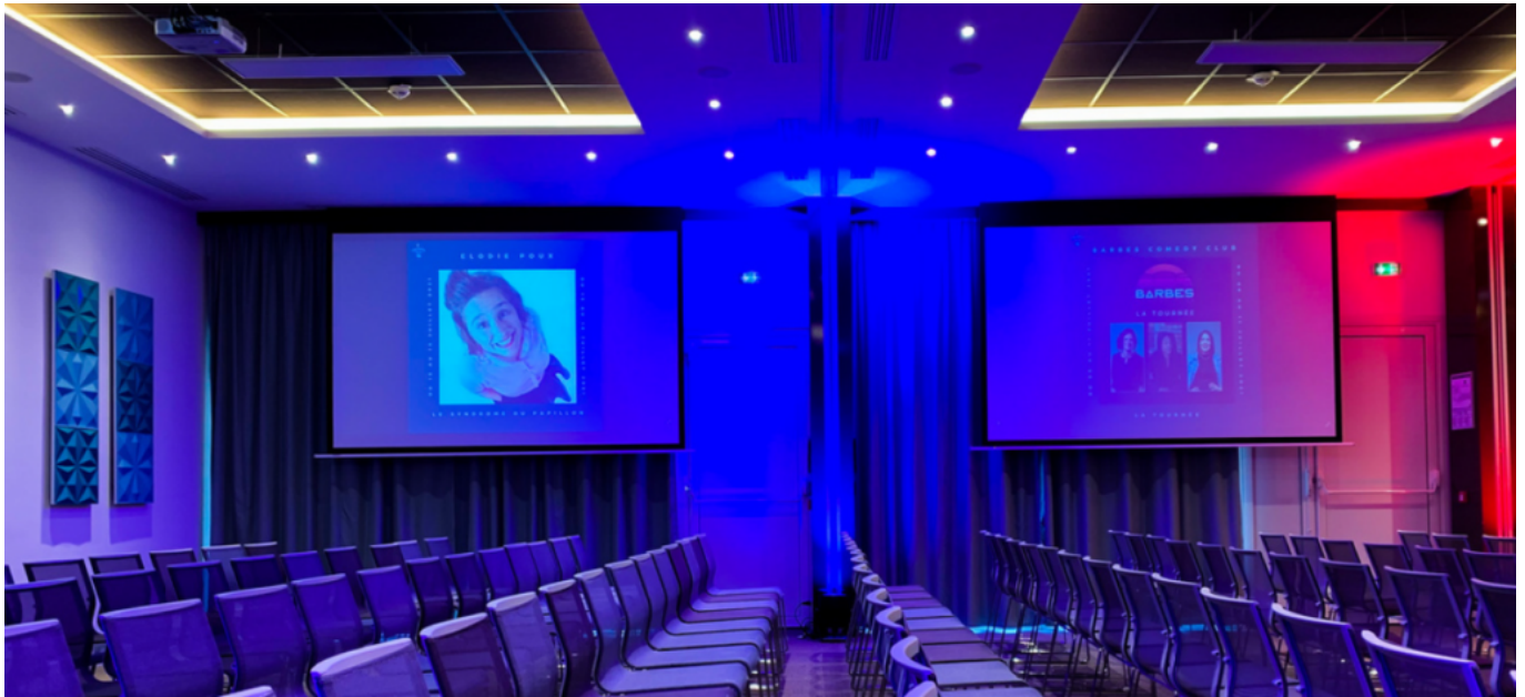
Des écrans ponctuent le mur latéral