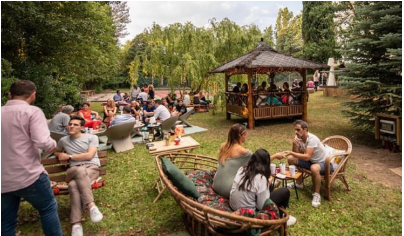
Pause rafraîchissement avant ou après le spectacle