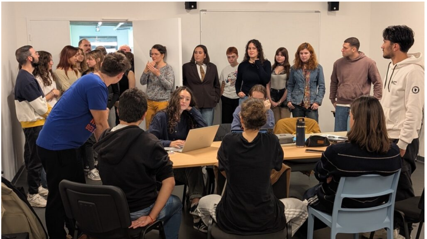
Les étudiants en Bachelor Acting & Théâtre ont fait leur rentrée ce lundi 13 octobre.

Le campus avignonnais comptabilise désormais trois formations : Bachelor Acting & Théâtre, Bachelor Son & Musique, et Bachelor Cinéma & Audiovisuel.