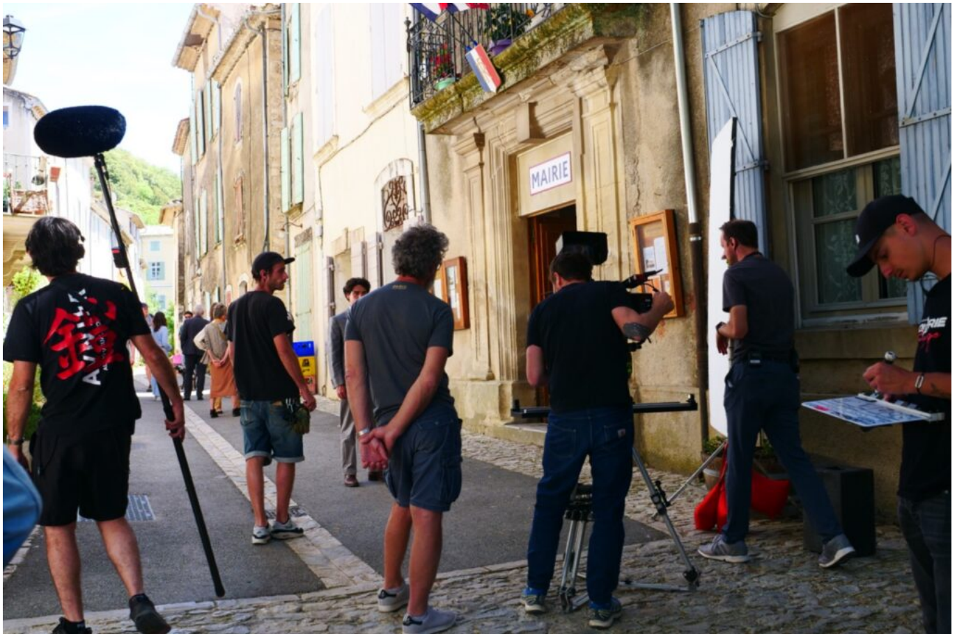
Tournage de L'Or bleu.