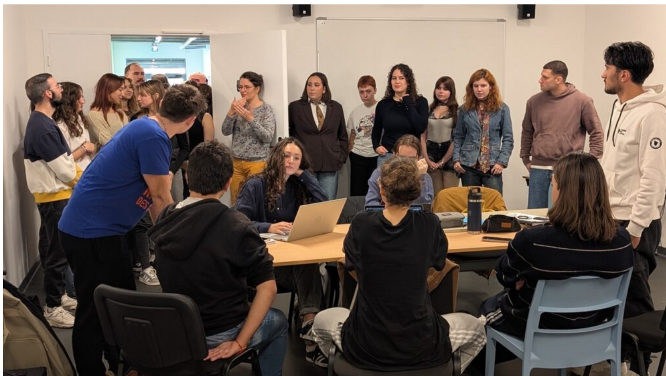
Les étudiants en Bachelor Acting & Théâtre ont fait leur rentrée ce lundi 13 octobre.

Le campus avignonnais comptabilise désormais trois formations : Bachelor Acting & Théâtre, Bachelor Son & Musique, et Bachelor Cinéma & Audiovisuel.