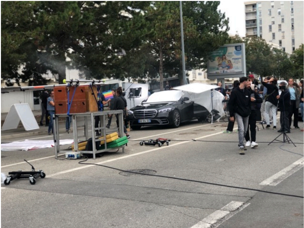
Tournage d' Exquis à Avignon.