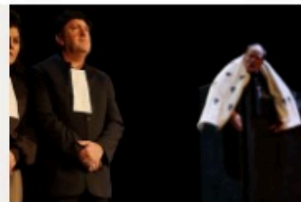
La Lionne, Gisèle Halimi