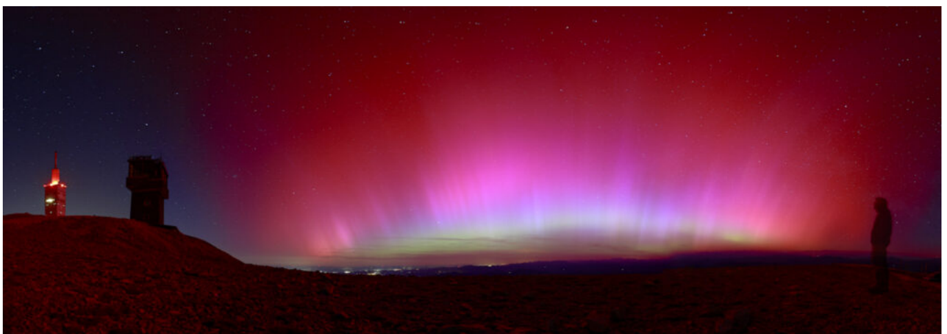
Panorama pris par le photographe Sébastien Bur dans la nuit du vendredi 10 au samedi 11 mai. ©Sébastien Bur

Nombre de photographes et d'amateurs se sont précipités au sommet du Mont Ventoux ce week-end avec l'espoir de capturer les aurores boréales. Ces dernières étaient bien visibles à l'œil nu ce vendredi soir, elles ont donné lieu à de magnifiques clichés de la part de talentueux photographes vauclusiens. « Nous n'étions que quatre ou cinq au Mont Ventoux ce vendredi à avoir pu profiter du spectacle », affirme le photographe Ken B., qui suit l'activité du ciel au quotidien grâce au site internet Space Weather Live qui donne l'activité solaire et les prévisions aurorales en direct.