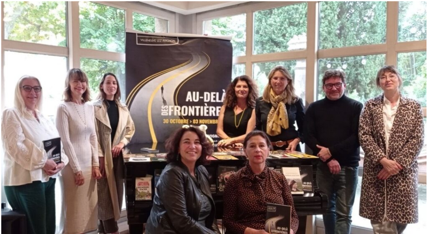
L'équipe organisatrice du festival.