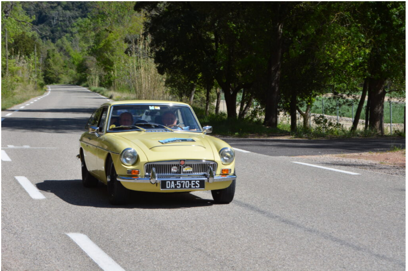
MG C GT de 1973