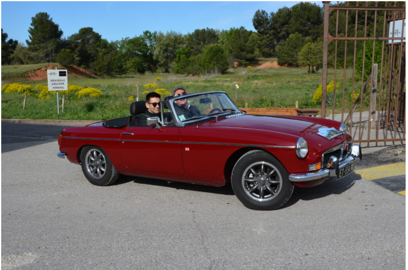
MG B de 1974