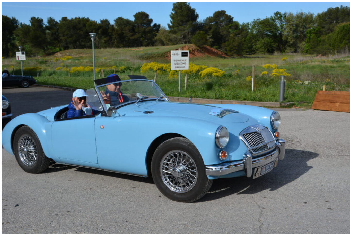
MG A 1600 de 1962

manifestation avait enregistré 3 000 visiteurs en 2 jours. Une belle performance pour un salon de taille plus modeste qui accueille quand même une centaine d'exposants.