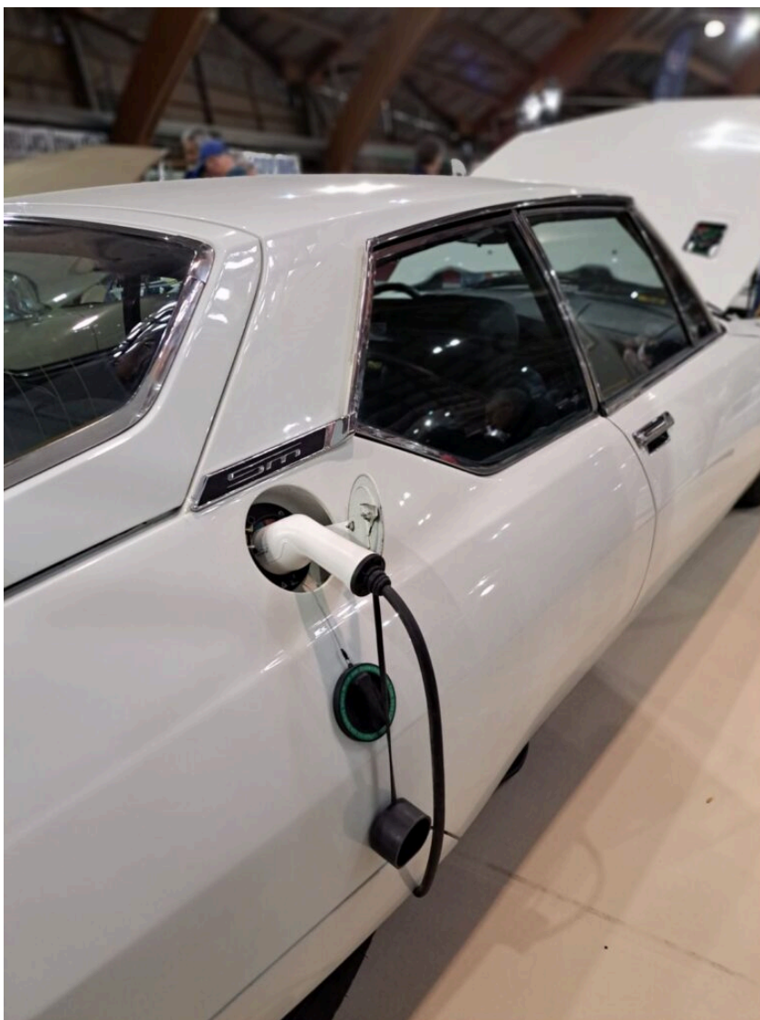
Unique SM Citroën électrique au monde