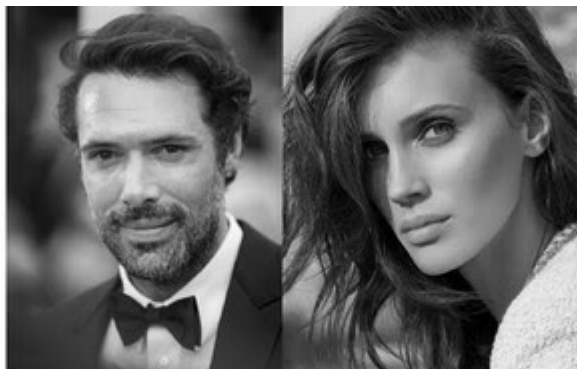
Nicolas Bedos (réalisateur) et Marine Vacth (actrice)

Synopsis : « Lorsqu'un jeune gigolo tombe sous le charme d'une sublime arnaqueuse, c'est le début d'un plan machiavélique sous le soleil brûlant de la Côte d'Azur. Les deux amoureux sont-ils prêts à tout pour s'offrir une vie de rêve, quitte à sacrifier celle d'une ancienne gloire du cinéma et d'un agent immobilier ? »