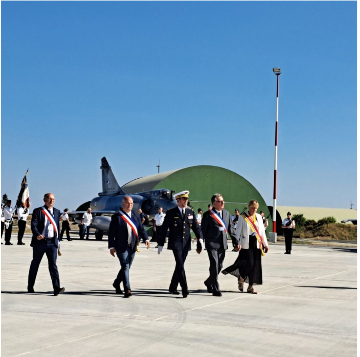
Yann Bompard, maire d'Orange (2e à gauche).