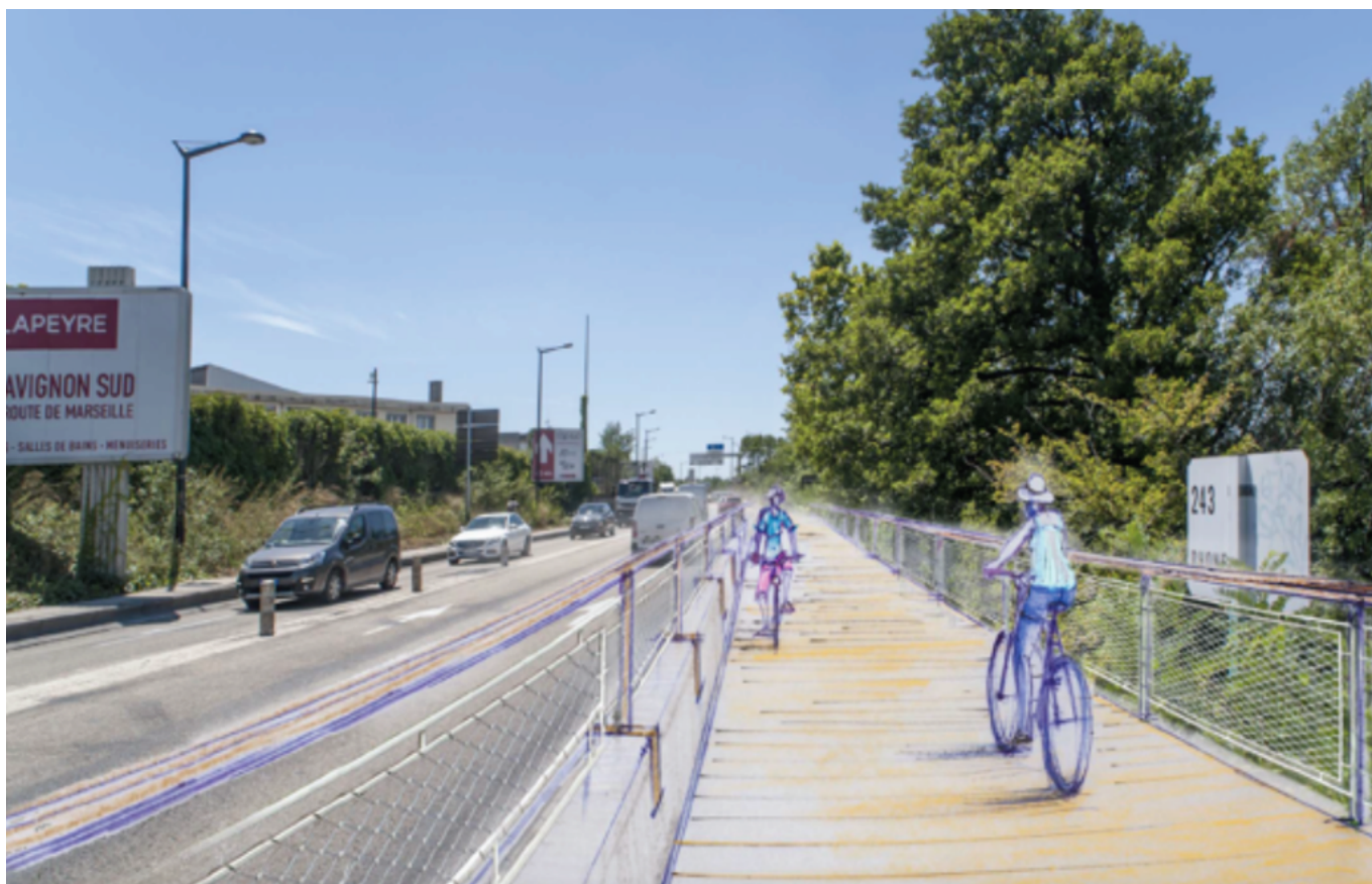
Projet LIASON MODES DOUX OULLE à CONFLUENCE