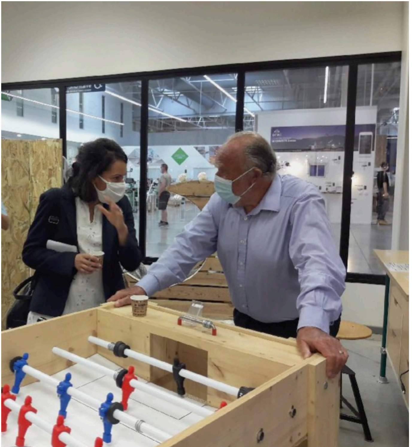
Henri Lachmann.