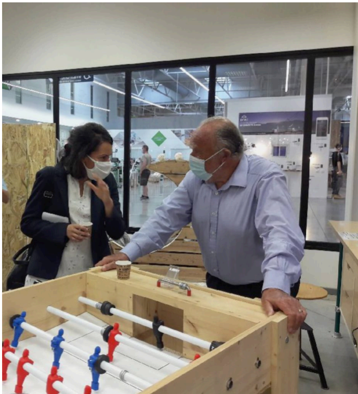
Henri Lachmann.