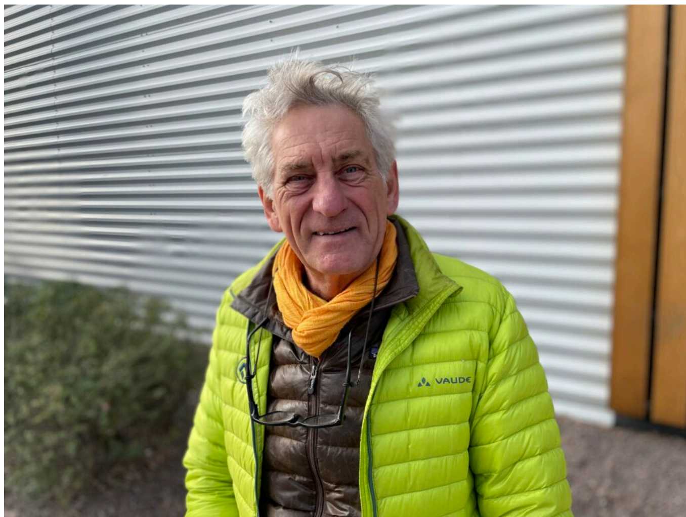
Pierre Duret Copyright MMH

Implanté au cœur de l'une des plus grandes zones commerciales d'Europe, l'espace bénéficie d'une visibilité exceptionnelle depuis l'axe routier le plus fréquenté du département et est facilement accessible depuis l'autoroute ou les routes nationales.