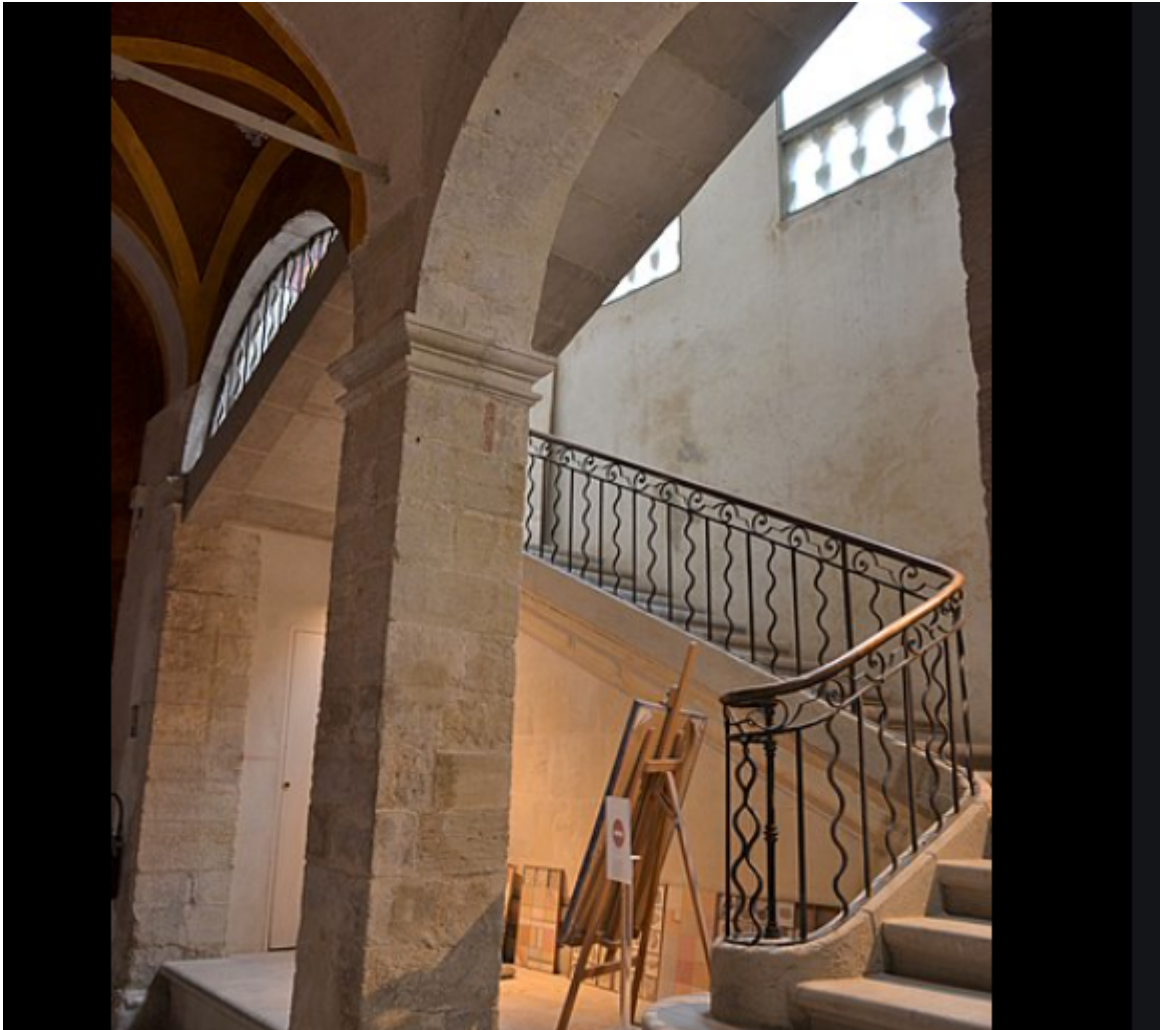
Rez-de-chaussée de l'Hôtel particulier du Roi René à Avignon