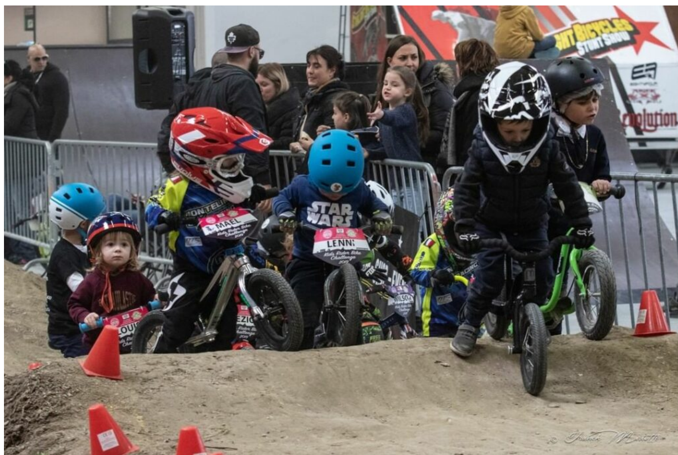
Les enfants de 2 à 5 ans pourront découvrir l'univers de la draisienne

Les enfants de 5 à 11 ans pourront passer de la draisienne au vélo avec le Pitchouns Bike Dual Slalom. Cette piste en accès libre proposera un parcours constitué de modules adaptés à la pratique de la draisienne et du vélo premier âge. Cette activité sera également encadrée par le centre social et culturel l'Espélido qui fournira aux enfants le matériel nécessaire : vélos, draisienes et casques.