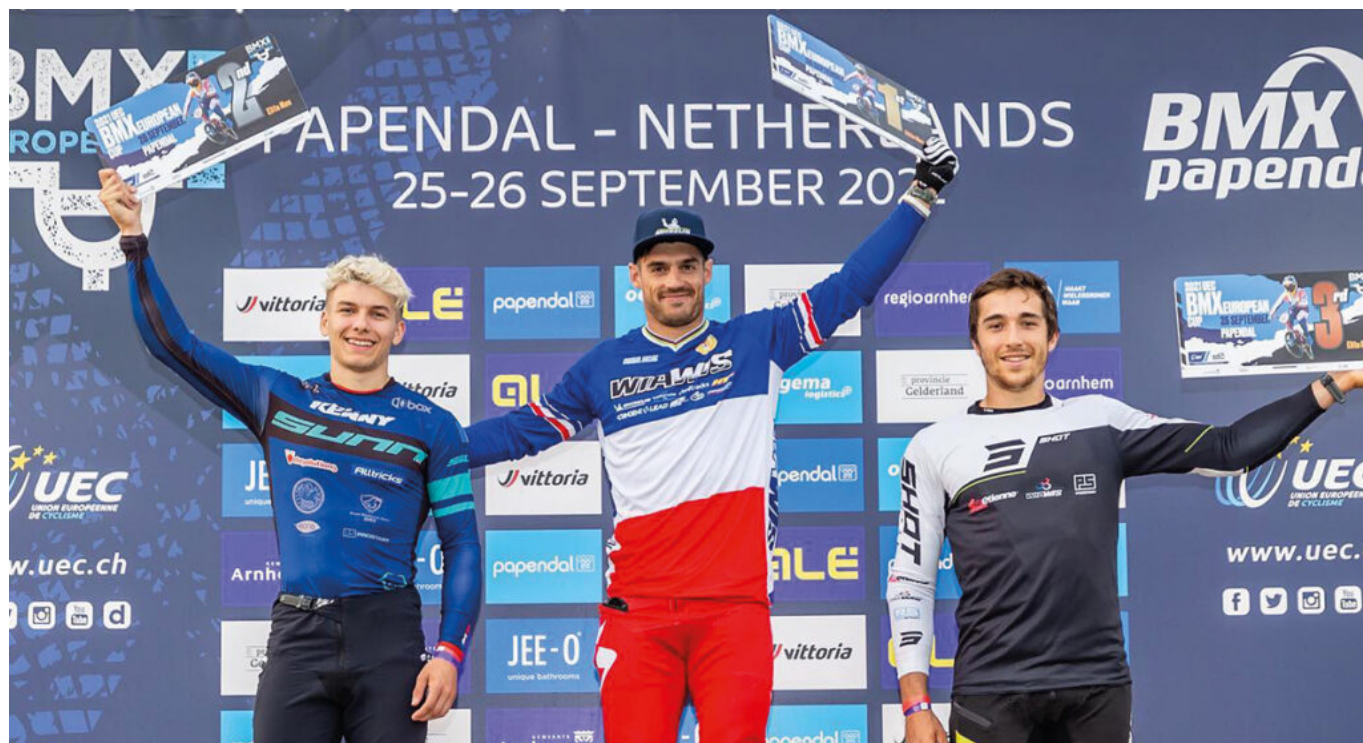
Sylvain André, vainqueur de la coupe du monde de BMX Racing 2022