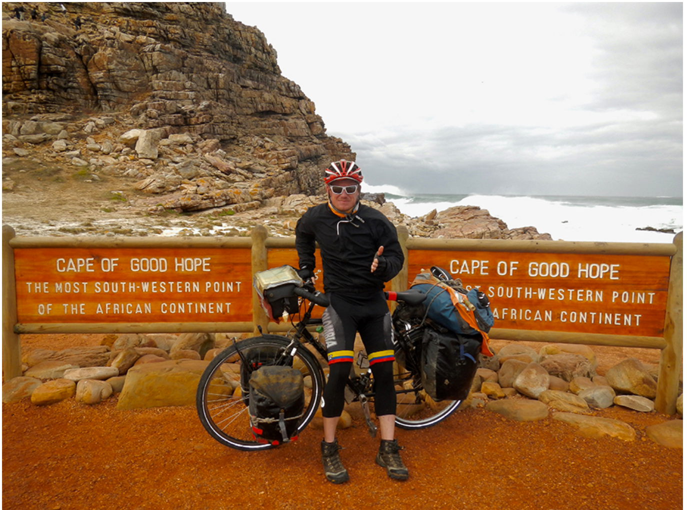
Pascal Bärtschi, l'aventurier à vélo.