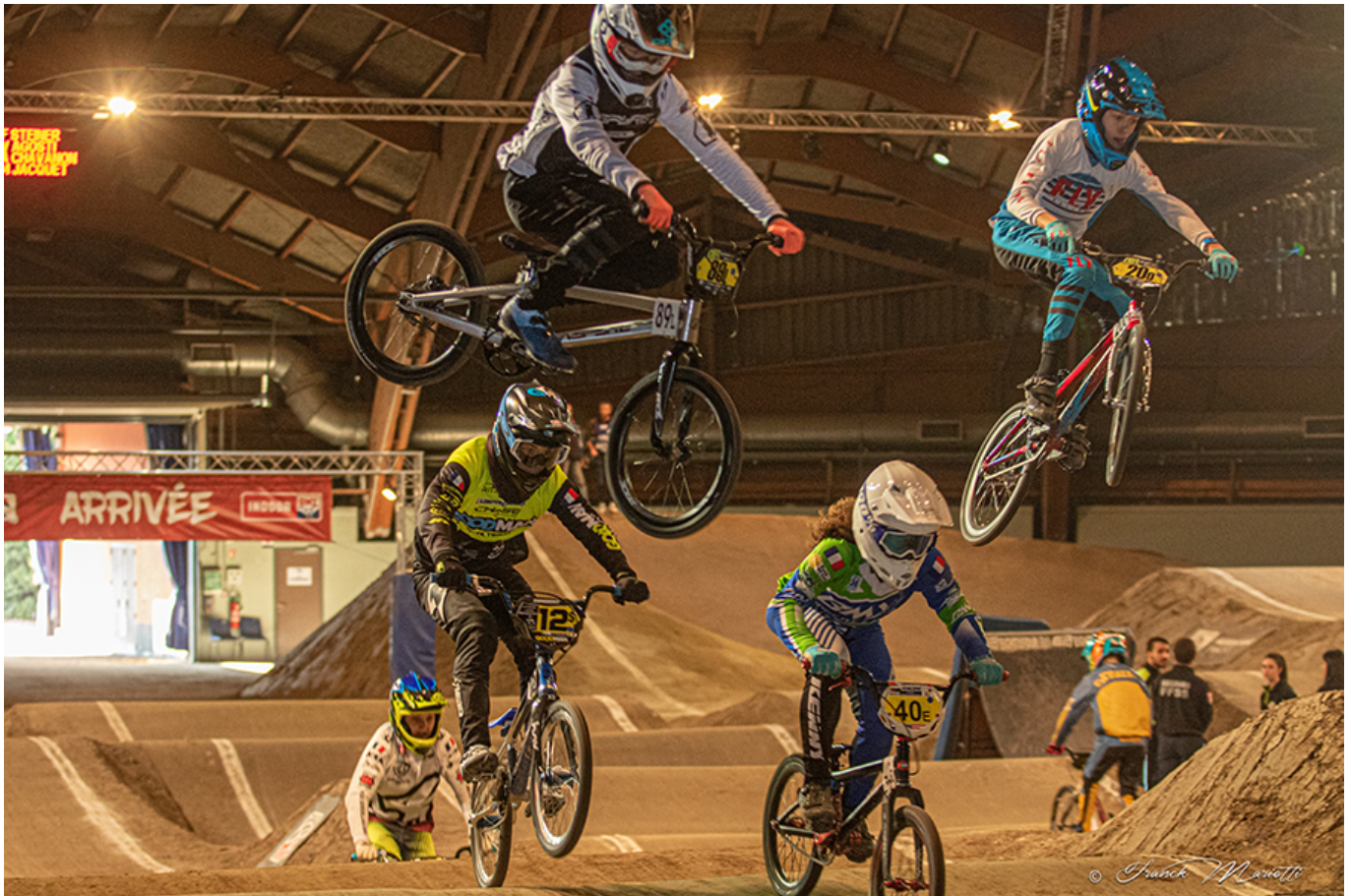
Indoor BMX pour les audacieux.