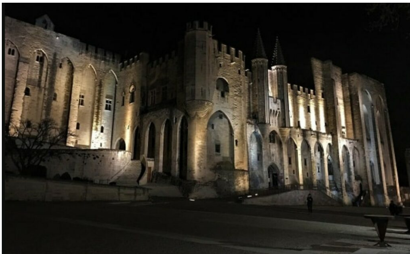
Le Palais des papes

À la tombée du jour, Avignon change de visage. Les façades médiévales prennent une nouvelle profondeur sous les éclairages, les places retrouvent leur quiétude et les rues se prêtent davantage à l'écoute qu'à la simple contemplation. Dans cette atmosphère plus confidentielle, les visiteurs découvrent des détails architecturaux souvent invisibles de jour, prennent le temps d'observer les perspectives et s'imprègnent d'une ville foisonnante d'arts pluriels. La fraîcheur des soirées parfois heureusement baignées de Mistral offre alors des conditions particulièrement agréables pour parcourir les rues, au gré d'un récit en mouvement.