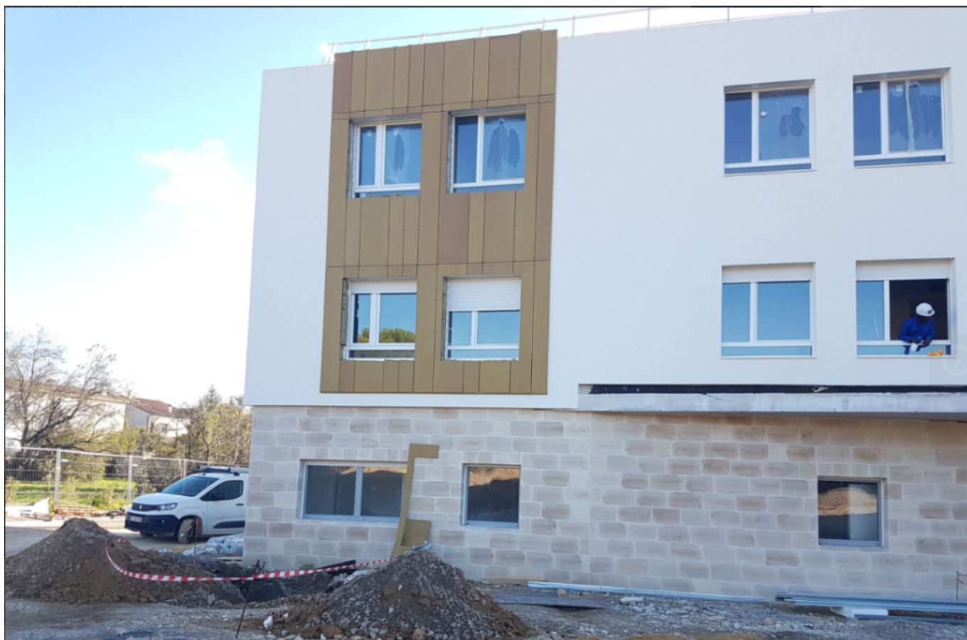
Ehpad de Bollène, enduits et isolation thermique, Copyright Benedetti SA

L'entreprise Benedetti est certifiée Qualibat (Qualifications et certifications) et RGE (Reconnu garant de l'environnement) à destination des professionnels : Avec plus de 4 500 projets réalisés depuis son origine l'entreprise Benedetti est un des leaders du traitement des façades et de l'isolation par l'extérieur du grand sud de la France. L'entreprise accueille plus de 80 salariés dont 50 compagnons, 22 contrats de formation et insertion Geiq (Groupement d'employeurs pour l'insertion et la qualification), Benedetti SA est le plus important employeur en insertion du Vaucluse, 6 chefs de chantier et 4 conducteurs de travaux. Benedetti SA. Avenue de Saint-Chamand. Zone industrielle de Fontcouverte. Avignon. Benedetti-sa@wanadoo.fr www.benedetti-sa.fr Benedetti Sa est une société adhérente à la Fédé BTP 84 .