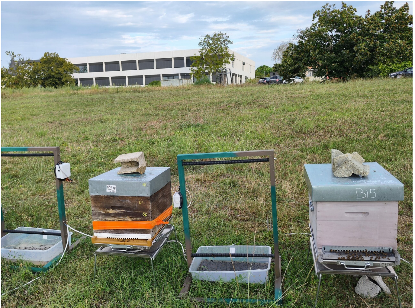
Les "harpes électriques" domaine Saint Paul INRAE

chercheurs en apidologie (branche de l'entomologie spécialisée dans l'étude scientifique des abeilles).