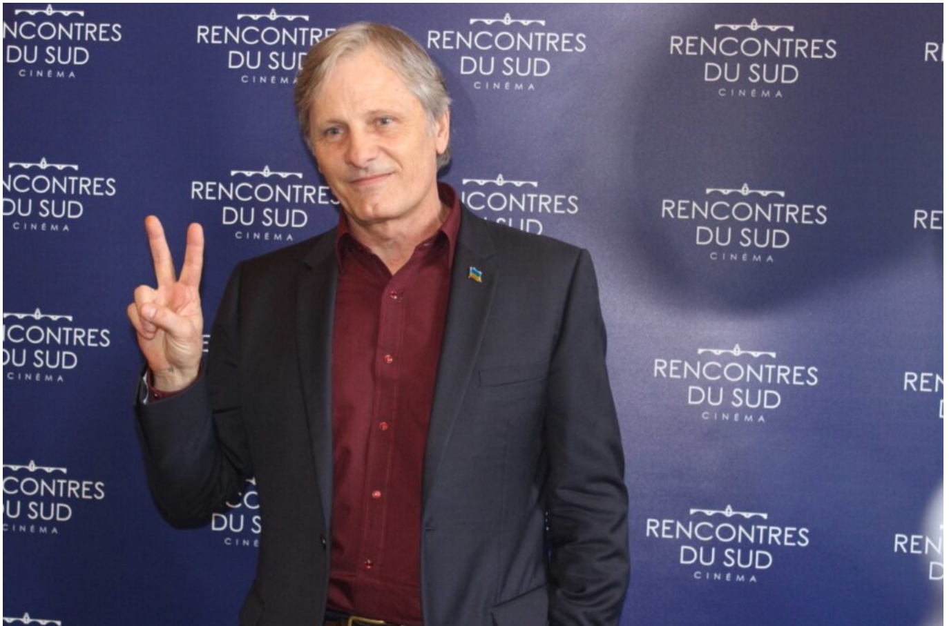
Viggo Mortensen.

Les êtres humains sont capables de faire beaucoup de mal. Il faut éduquer chaque génération et c'est ce que ce père va faire avec ce petit garçon. On vit dans l'espoir », conclut l'humaniste et citoyen du monde qui parle français. Un western aux sensations fortes et un drame romantique.