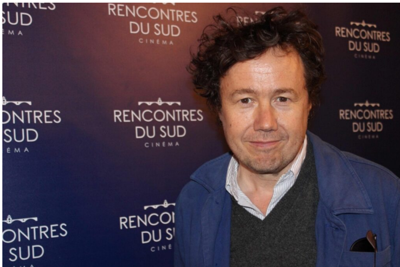
Yvan Calbérac.

Un film ludique, divertissant, et un véritable parcours initiatique.