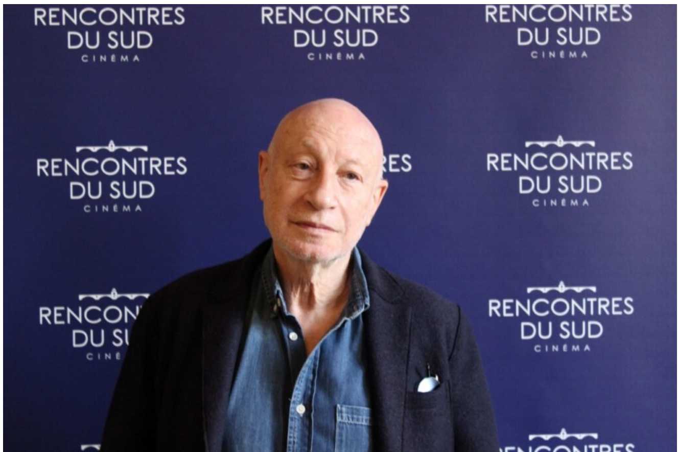
Pascal Bonitzer.

« Les gens qui croient que leur destin va basculer parce qu'ils touchent beaucoup d'argent, cela risque de se retourner contre eux », conclut-il.