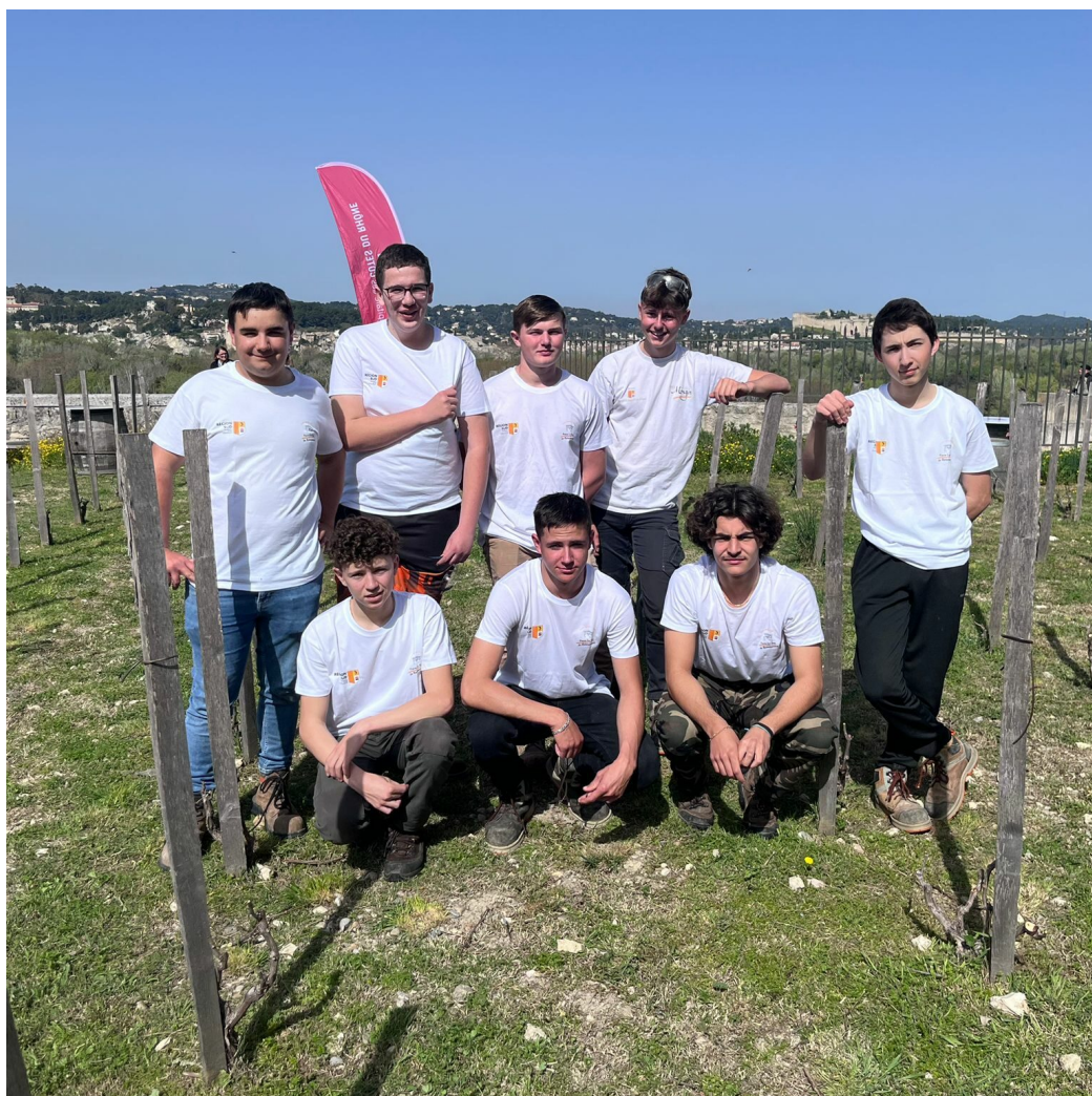
Les élèves du lycée viticole d'Orange