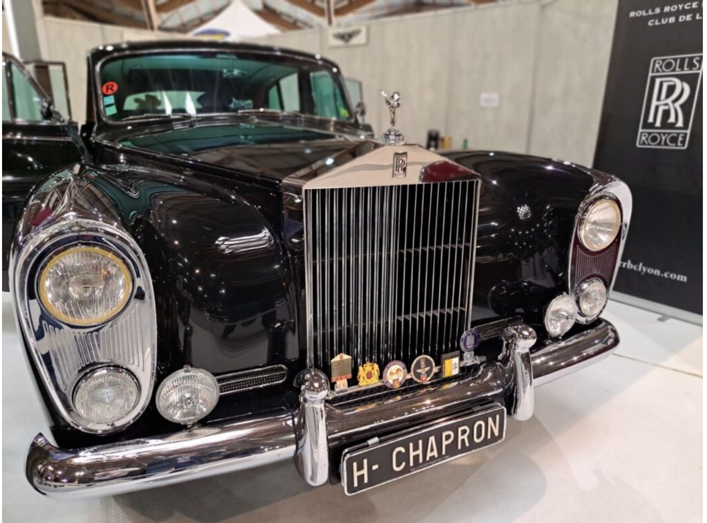
Rolls-Royce Phantom 5