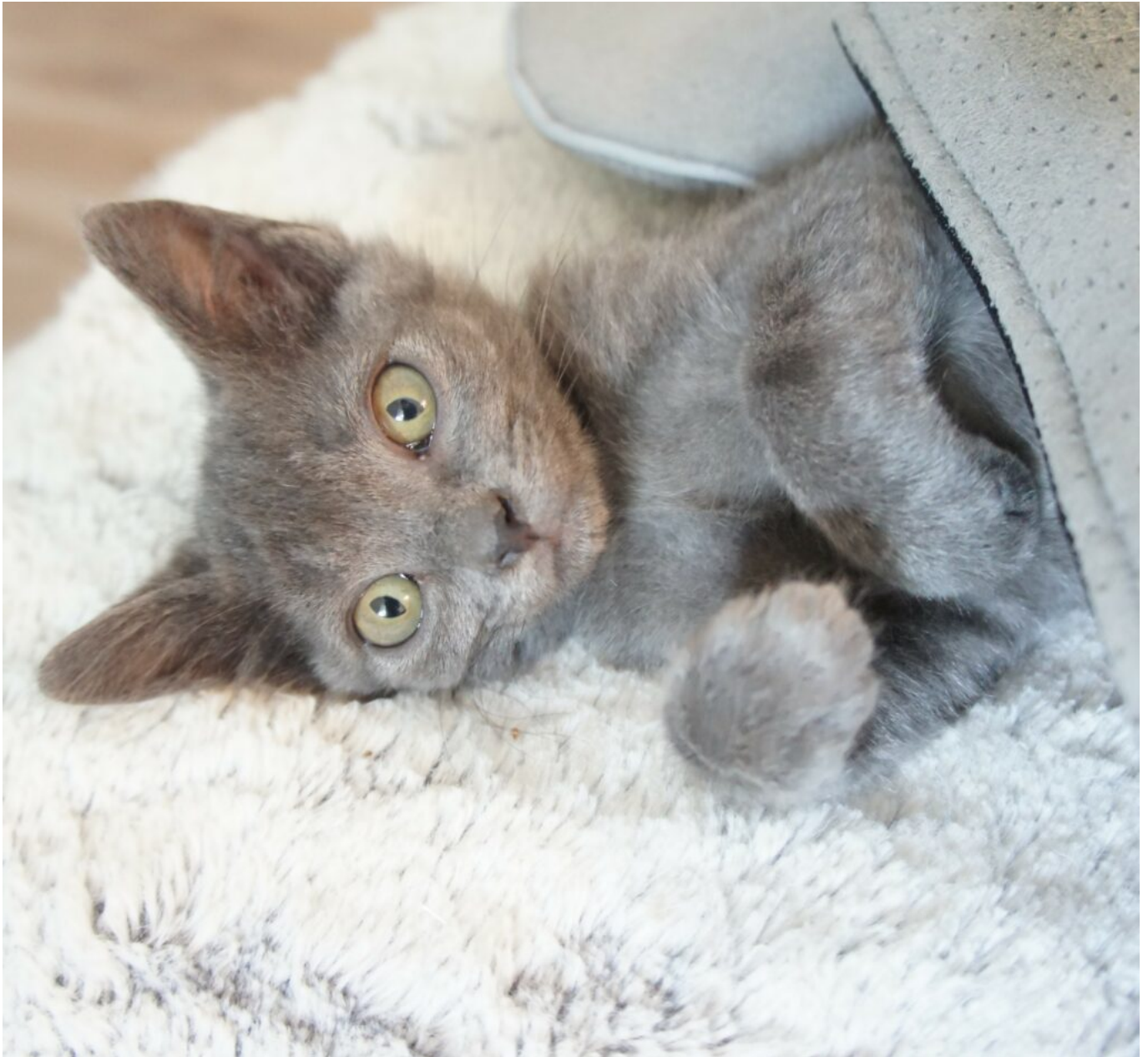
Un des petits chatons sauvés

nous vendons des objets de seconde main issus de dons en circuit court, dans une éthique éco-responsable. Notre objectif à terme est d'ouvrir notre propre boutique solidaire. Pour le moment, nous vendons livres, vêtements, objets de décoration ou d'ameublement sur des plateformes internet, sur des vide-greniers à la belle saison, et chez Bibeloc, vide-grenier permanent situé à Avignon.