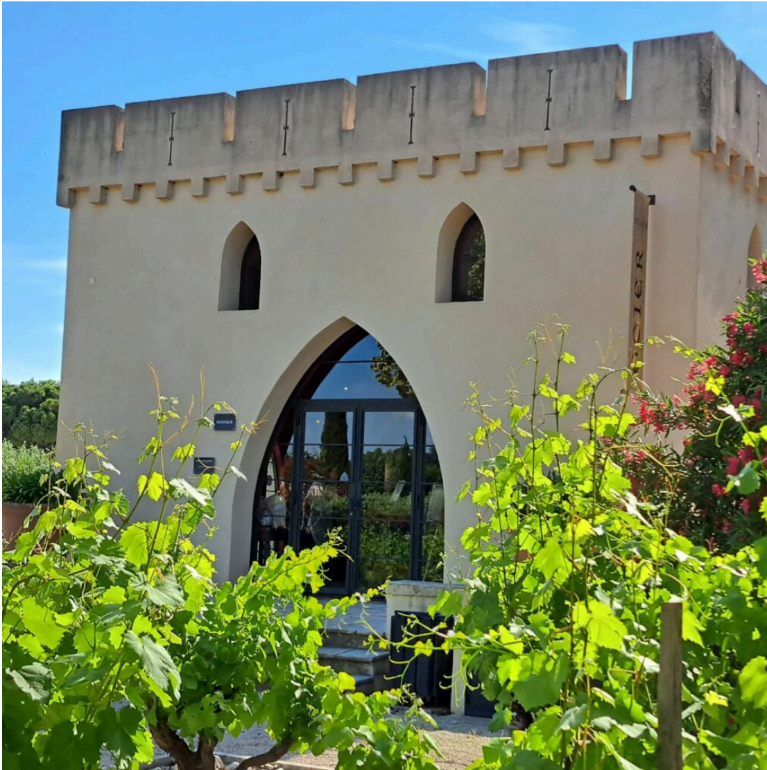
La maison Ogier.

Ce dîner pantagruélique s'est poursuivi par un magret de canard grillé dans un bain de beurre clarifié, avec piment d'Espelette et l'oignon doux de Roscoff rôti et jus de volaille intense, accompagné d'un tannique Beaune Vieilles Vignes. Plat n°6 : une fleur de courgette farcie de pépites de ris-de-veau caramélisées et crème de tartufata (truffe & champignon), une vraie prouesse technique pour arriver à un plat aussi beau visuellement et aussi bon gustativement. Arrosé d'un Médoc Cru Bourgeois de 2019, le mythique Château Patache d'Aux.