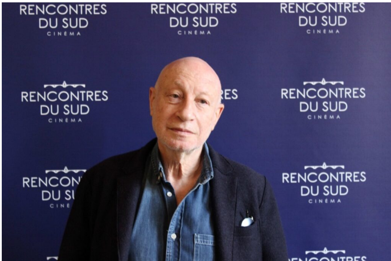
Pascal Bonitzer.

« Les gens qui croient que leur destin va basculer parce qu'ils touchent beaucoup d'argent, cela risque de se retourner contre eux », conclut-il.