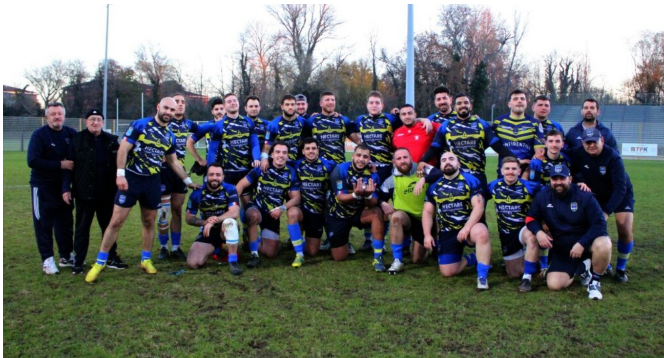
L'équipe première vient de remporter le derby contre les Angles.