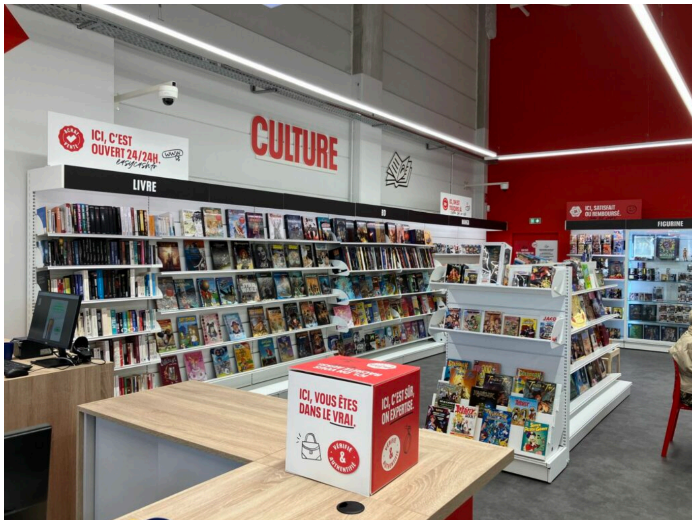
Le magasin d'Avignon.

des Français, expliquent les deux franchisés. Il véhicule des valeurs en phase avec les nôtres : un mode de consommation responsable et vertueux et le goût de la rencontre et de la proximité. »