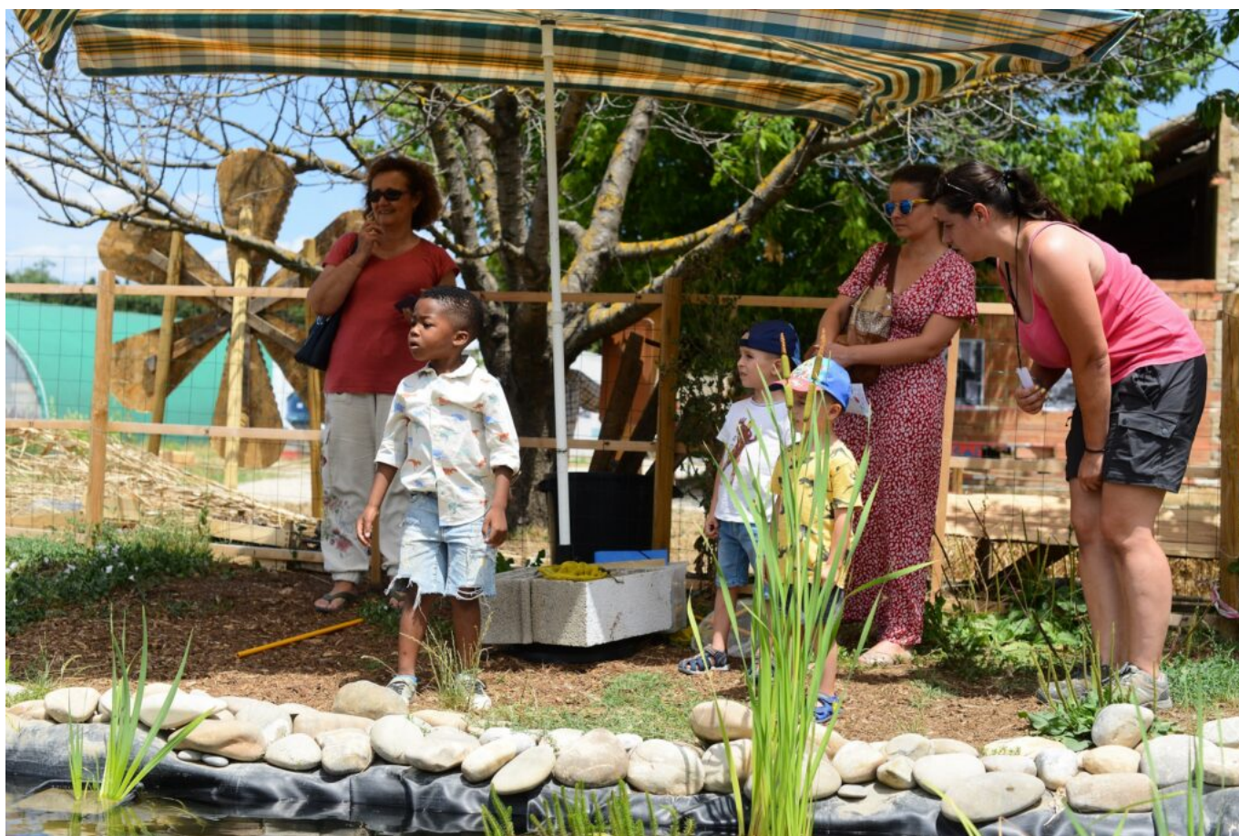
Atelier Découverte des habitants de la mare