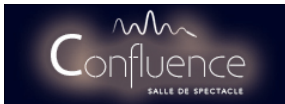
Logo de la future salle basée en Courtine.