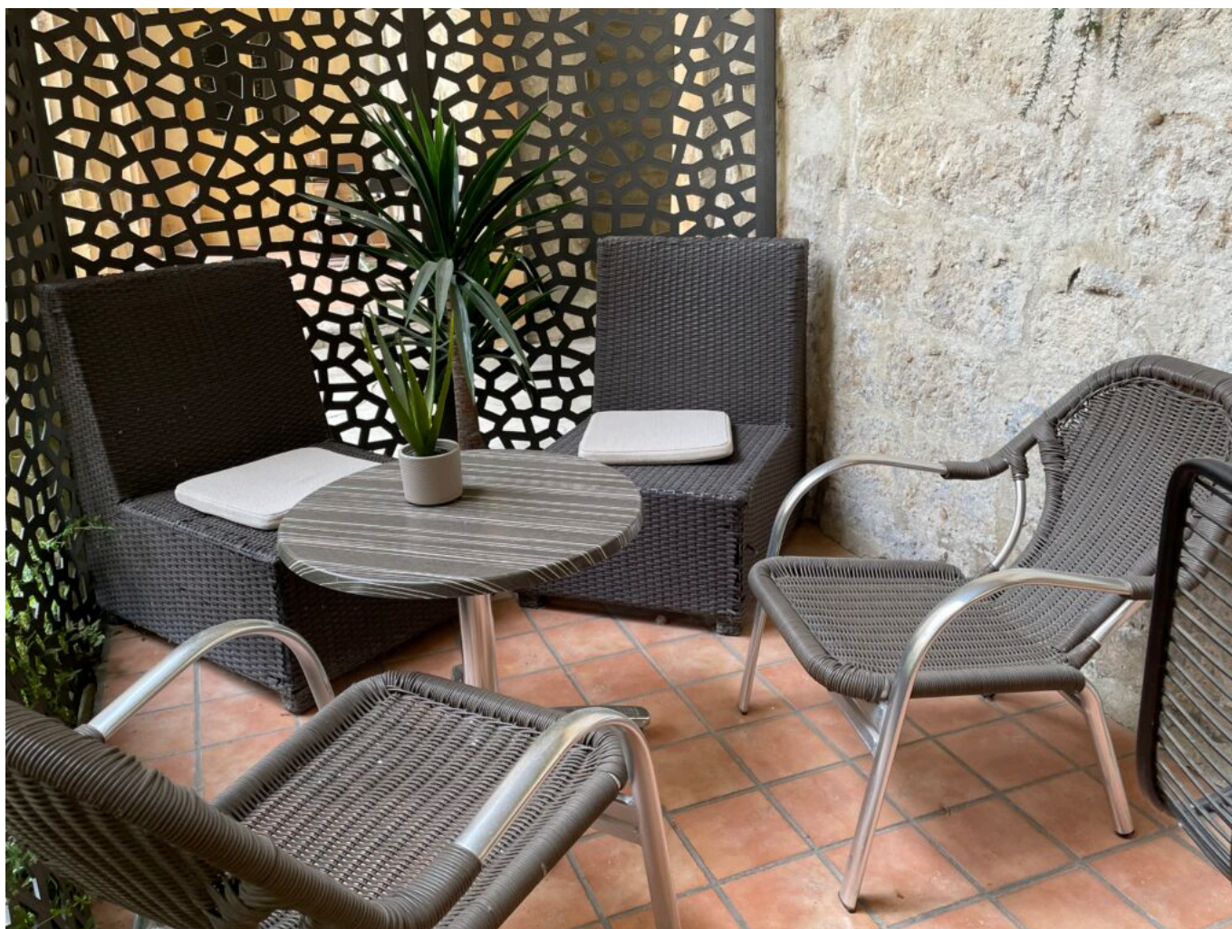
La terrasse aménagée pour boire son thé roïbos entre amis