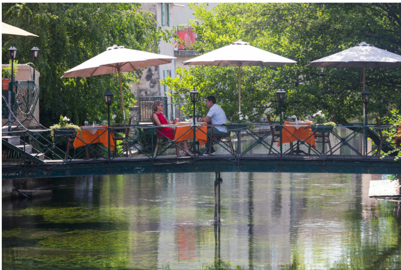
GAILHOL X - VPA

À l'occasion de la deuxième de la journée des terrasses qui s'est tenue cette semaine, France Boissons a publié un baromètre qui témoigne de l'attachement des Français aux terrasses et a révélé des chiffres régionaux inédits. Les natifs du Sud-Est sont ainsi ceux qui vantent le plus le mérite de leurs terrasses, ces lieux de vie incontournables.