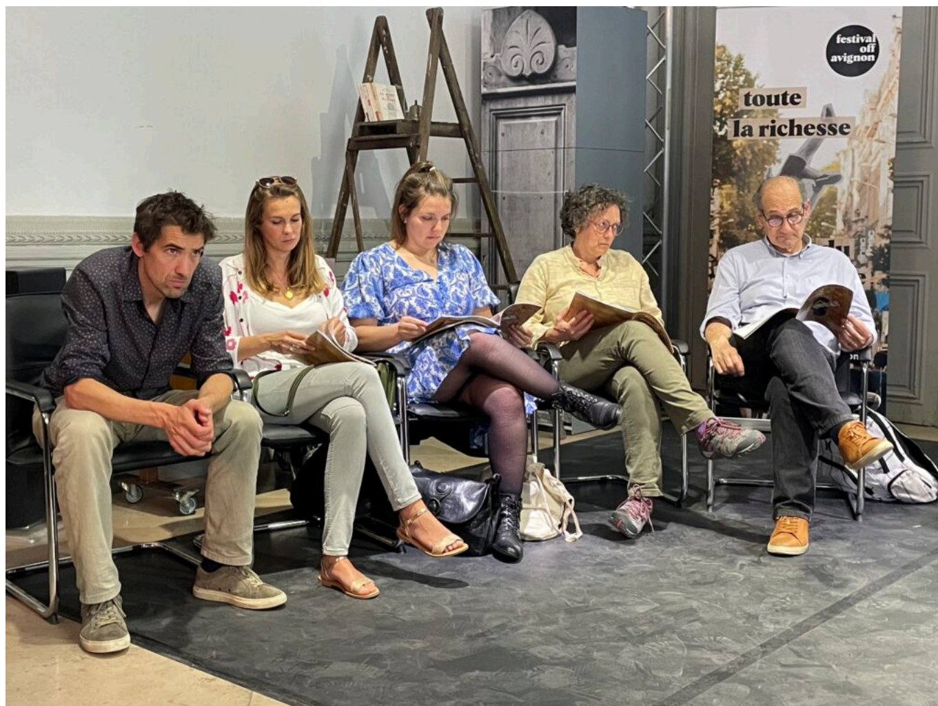
Des membres du Conseil d'administration