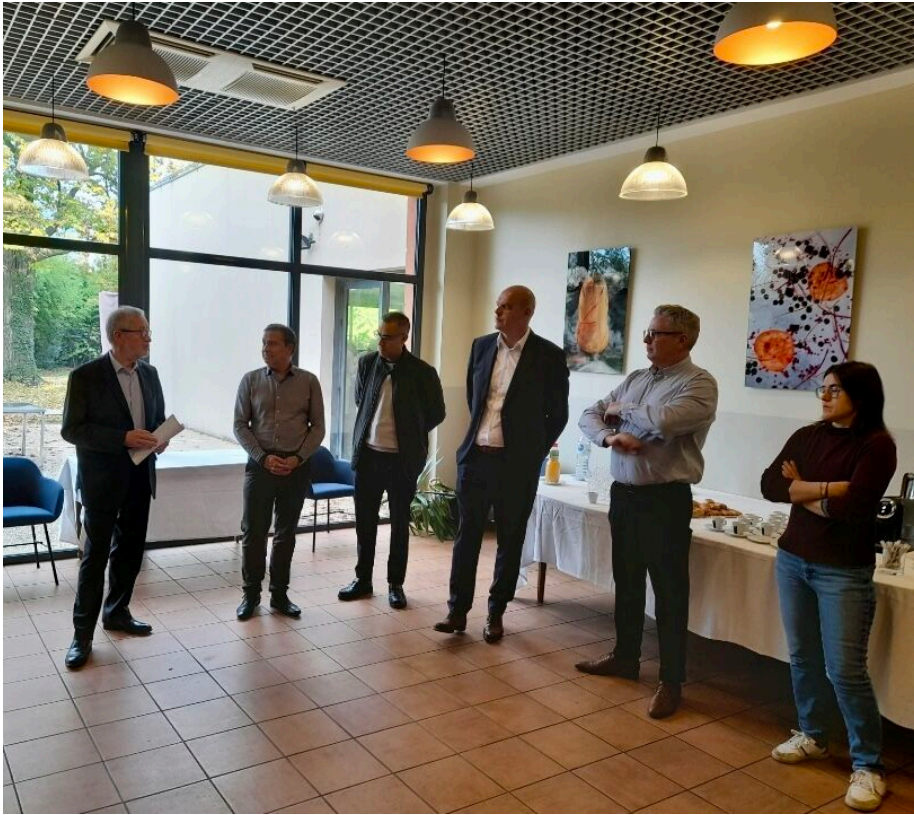
Le lancement officiel de la première session du Campus Pyro à Avignon.