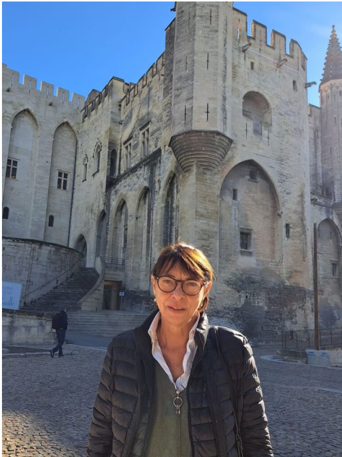
Sylvie Pellegrin, présidente du réseau 'Gîtes de France'.

roulote d'un camping, de cabanes perchées ou de chambres d'hôte. C'est un label, la 3 e marque la plus connue des Français pour le tourisme, avec un cahier des charges précis et entre 1 et 5 épis selon le degré de confort. »