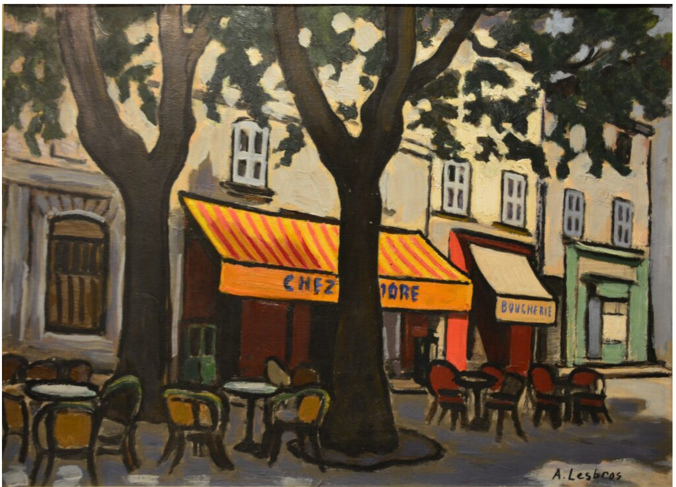
Les Corps Saints à Avignon