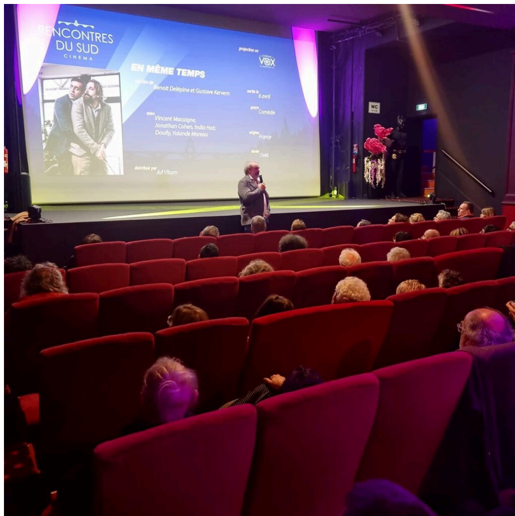
Les Rencontres du Sud en 2018.