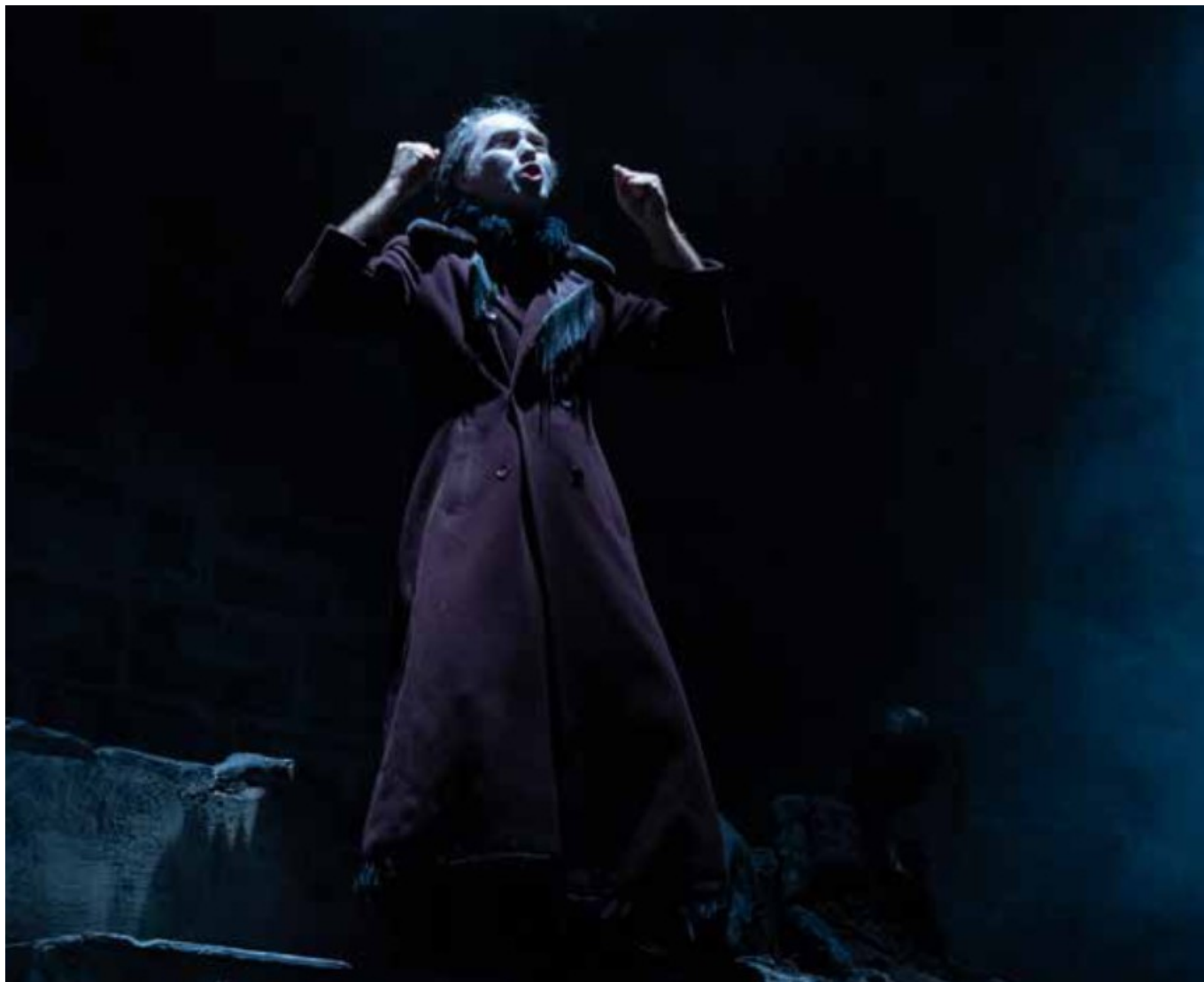
Les souffrances de Job. (crédit : Serge Gutwirth)