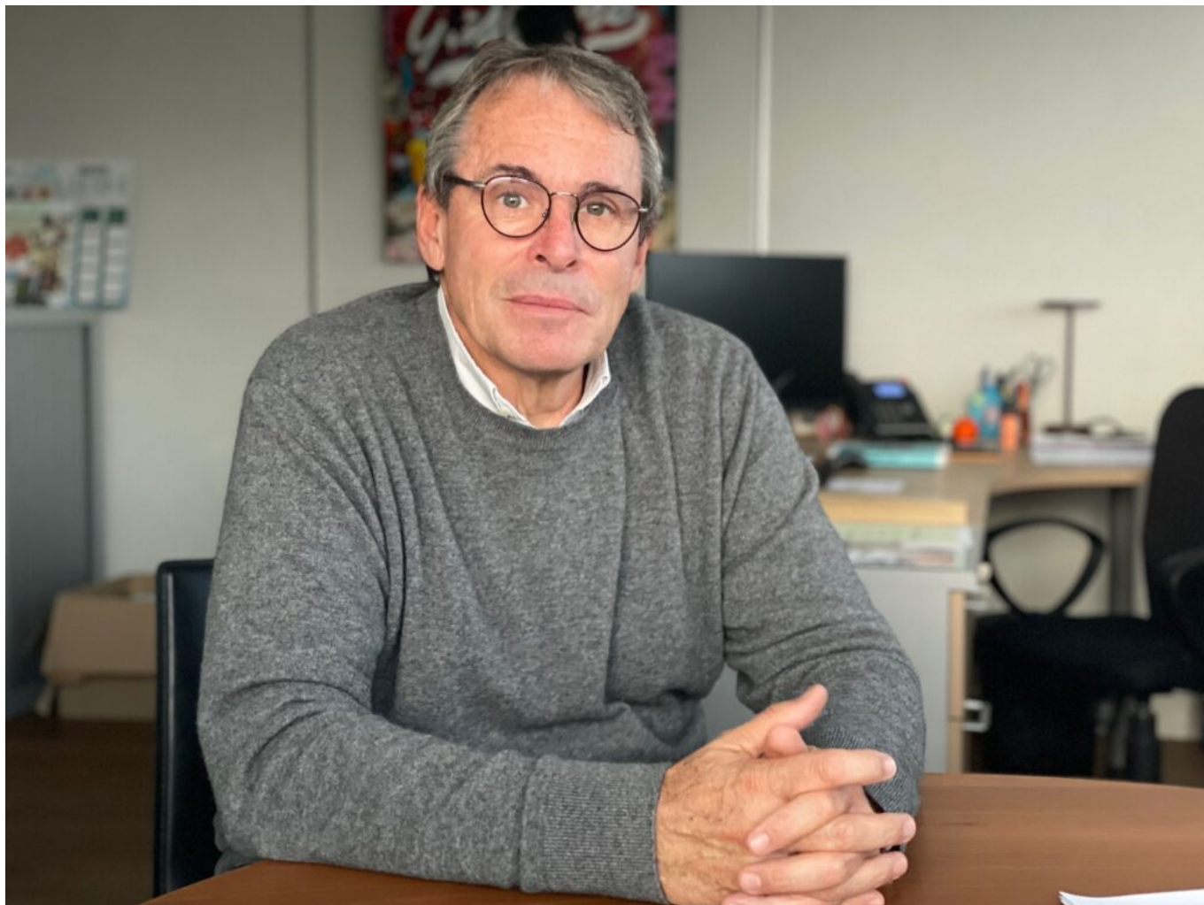
Eric Dupressoire Copyright MMH