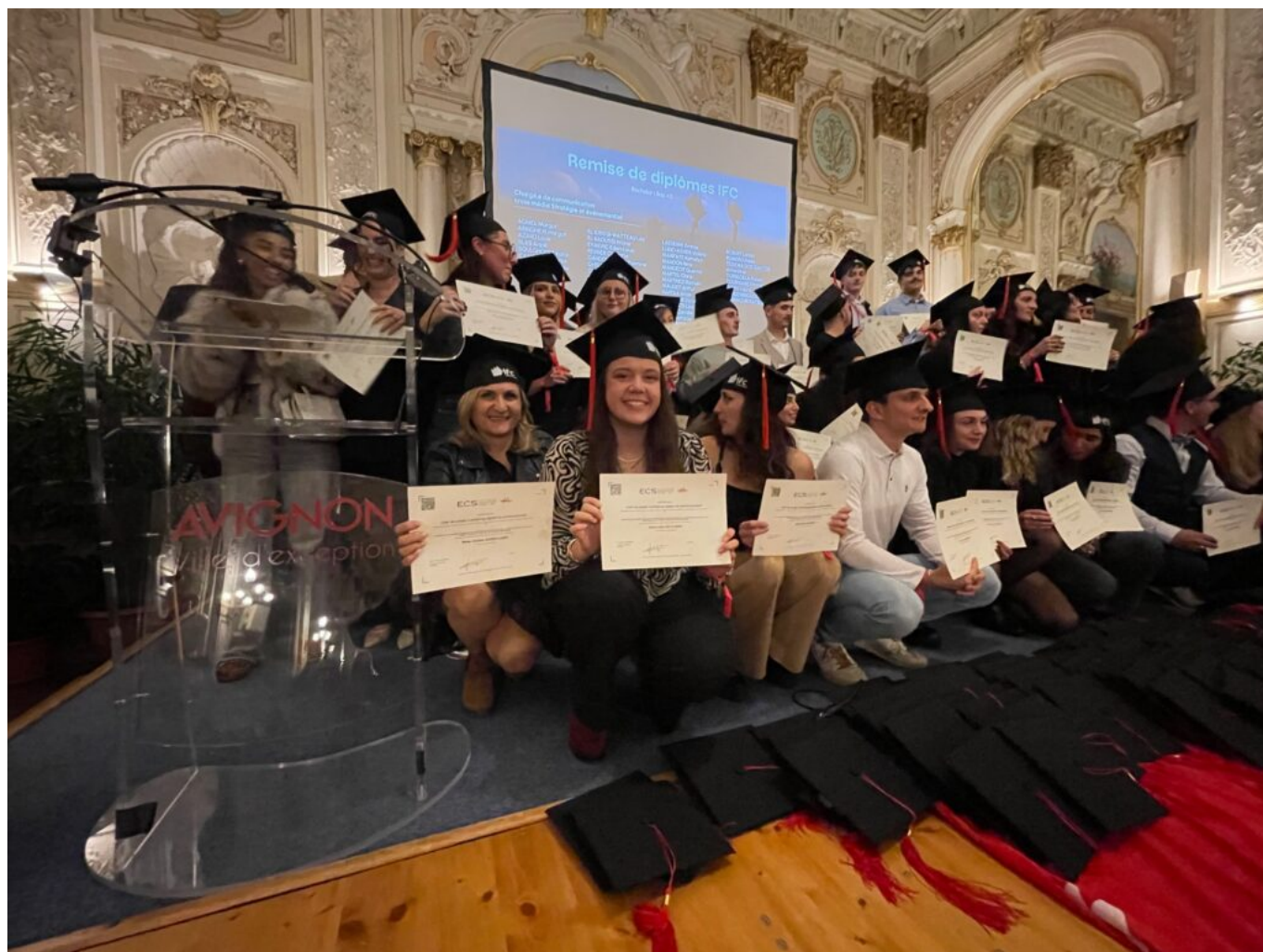
Remise de diplômes IFC

Si IFC est aujourd'hui un groupe, sa culture reste profondément avignonnaise. Dans la cité des papes, il est rare de ne pas croiser quelqu'un qui y a étudié, y a travaillé ou y a inscrit un enfant. Près de 30% des salariés sont d'anciens étudiants ; beaucoup reviennent comme formateurs, tuteurs d'alternants ou recruteurs. Le bouche-à-oreille joue à plein dans un bassin de vie décrit par Mathieu Dupressoir comme « un grand village où la réputation se construit sur la durée ».