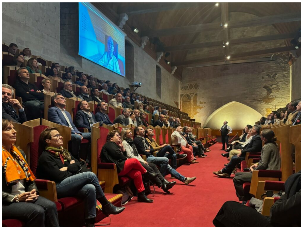
BDDD en séminaire au centre des congrès du palais des papes.

« L'entreprise a besoin d'un directeur financier, peut-être 2 jours par semaine, mais comme il est salarié à temps plein on lui affecte d'autres missions pour compléter son temps de travail et bien sûr des missions en dehors de son cœur de métier. Aujourd'hui, grâce à Bras Droit des Dirigeants ces mêmes entreprises peuvent avoir un DAF 2 jours par semaine, puis une DRH une journée par semaine et un DSI une autre journée. Autant d'experts dont elles ont besoin, avec des missions réalisées par l'expert dont c'est le métier »