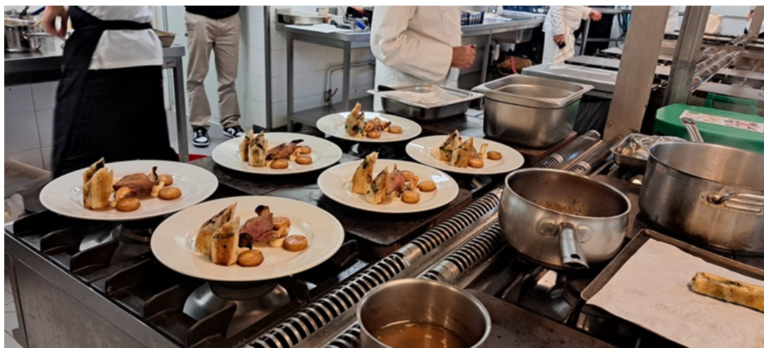
En cuisine, le canard de barbarie.

Comme plat : canard de Barbarie en deux façons, suprême cuit sur coffre, cuisses en pastilla et déclinaison de panais, qui exige de détailler cuisses, manchons, ailerons, de réaliser une sauce salmis et, à partir des panais, des chips et une sauce mousseline. Le tout présenté artistiquement en portions coupées en biseau. Enfin, pour le dessert, un crêmet avec tuile croustillante et suprêmes d'orange aux jeunes pousses, une composition élégante élaborée avec faisselle, crème chantilly, basilic et capucines.