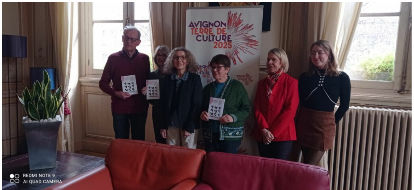
Responsables et membres de l'association Maca' lors de la conférence de presse