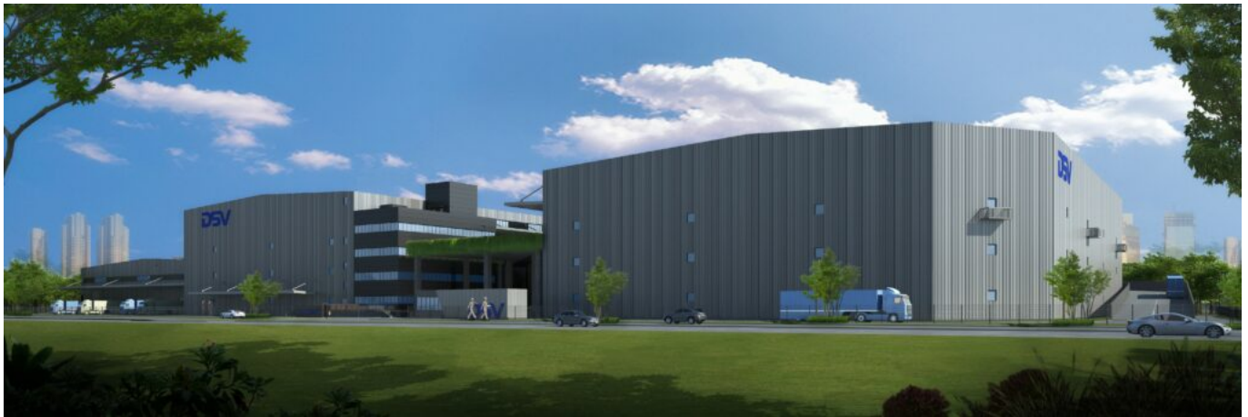
Modélisation des bâtiments logistiques construit par GSE pour DSV Logistics.