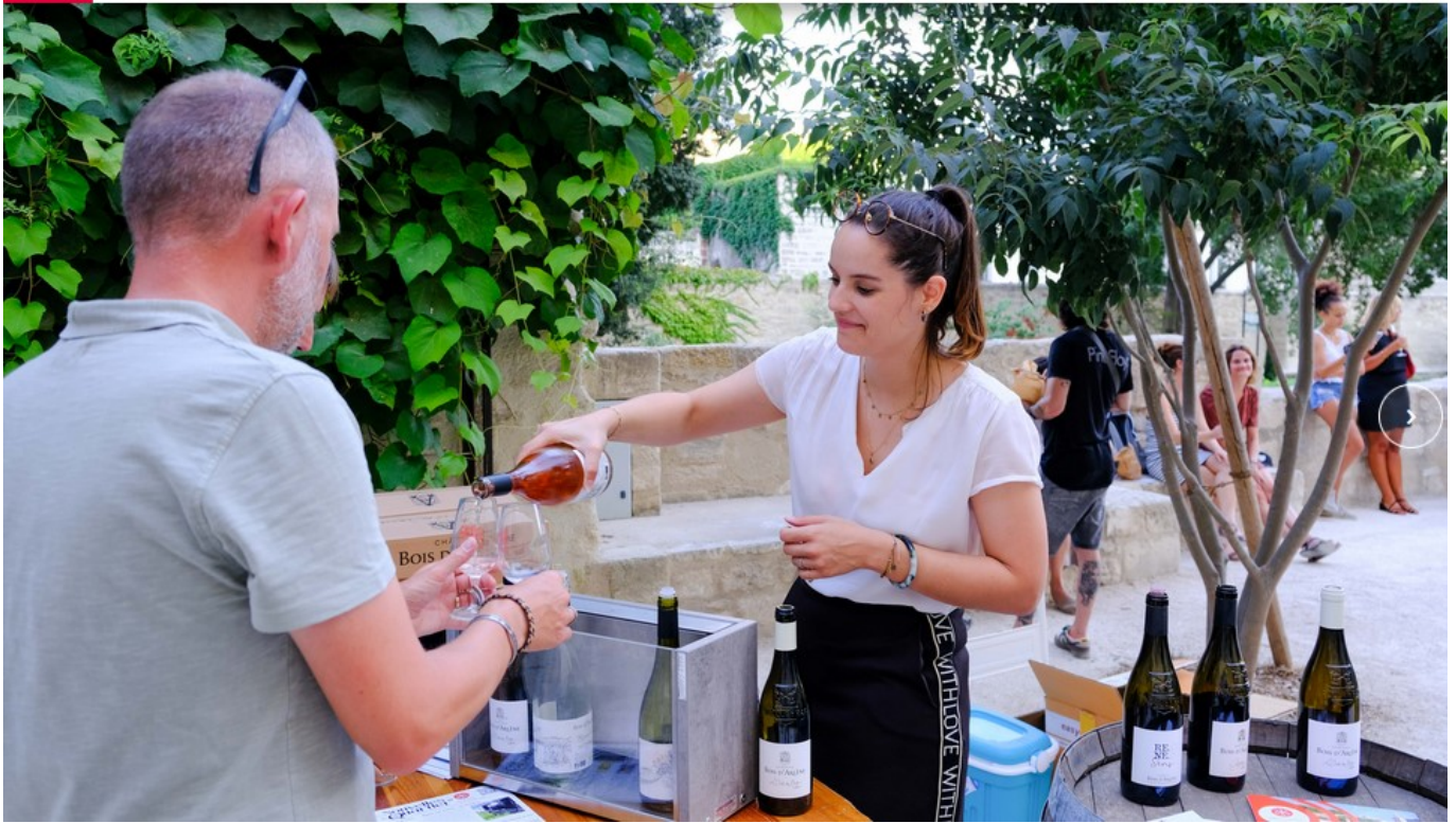
DR Un verre au jardin