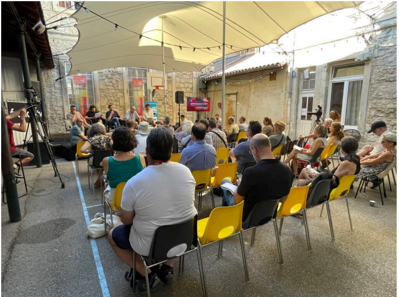
La conférence de presse au Village du off lors du pré-bilan du Festival off d'Avignon