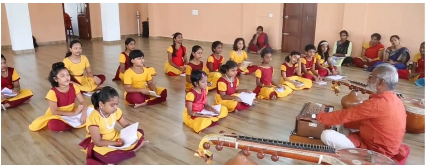
Leçon de chant