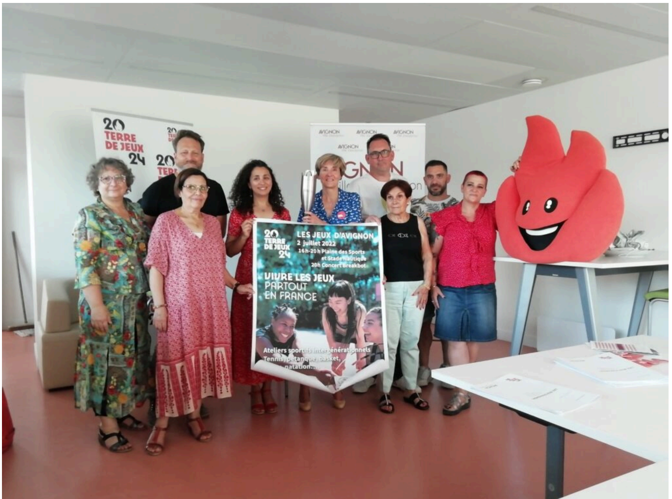
La municipalité d'Avignon lance les 'Jeux d'Avignon', première initiative de la ville sous le label 'Terre de Jeux 2024'.

Le 2 juillet, de 9h à 13h, les Avignonnaises et les Avignonnais pourront traverser les quartiers de la ville en portant la flamme de 'Terre de Jeux'. Le départ sera donné à 9h sur l'île de la Barthelasse, avec un invité de marque : Jérémy Azou , Champion olympique en deux de couple poids léger masculin aux Jeux olympiques d'été de 2016. L'arrivée de la flamme se fera aux Halles Géricoud où diverses animations seront présentes.