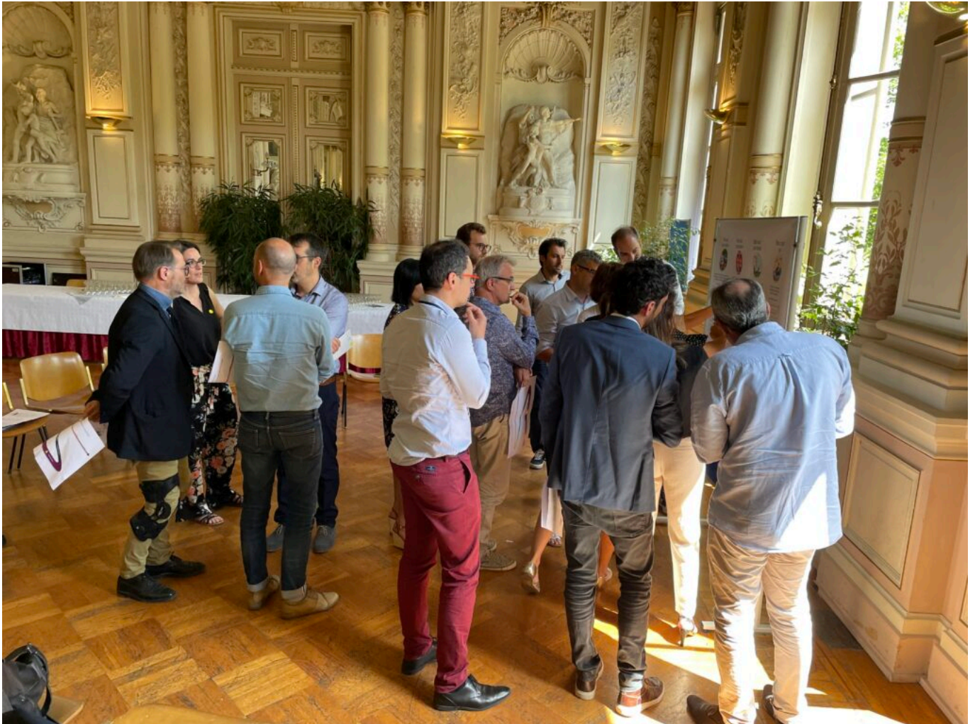
Comprendre, dialoguer, statuer