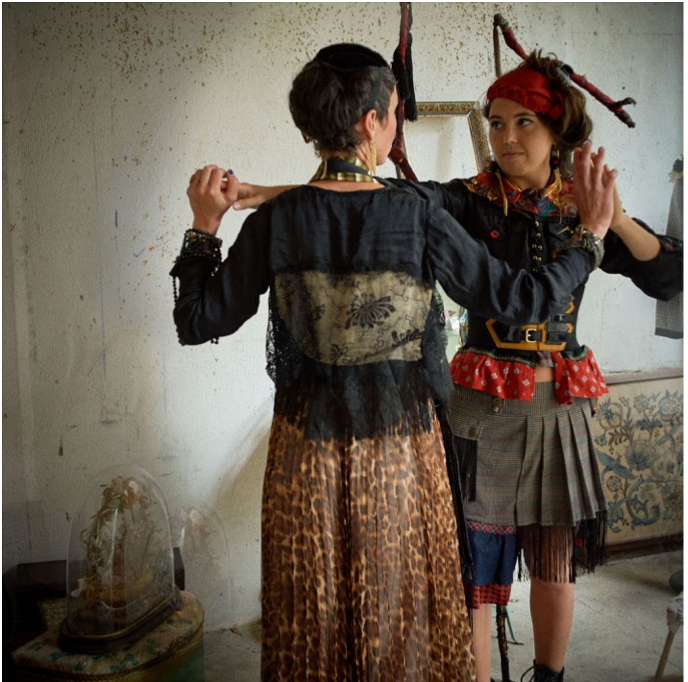
Photo « Ange ou démon » Collection Madame sans Gêne » par Gérard Rouxel