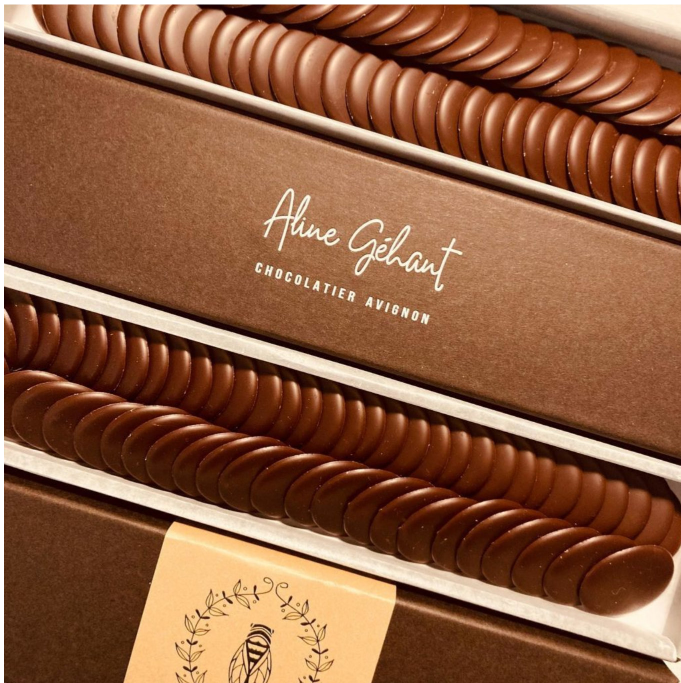
Papilles en ébullition... Crédit photo: Aline Géhant chocolatier