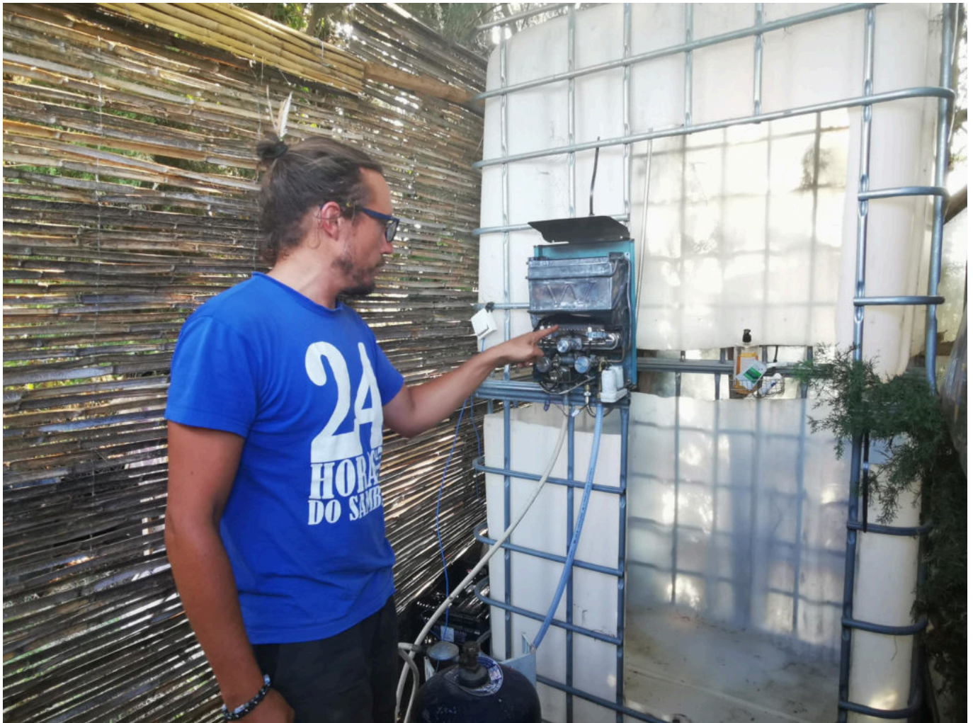
Prendre sa douche en compagnie des rossignols...