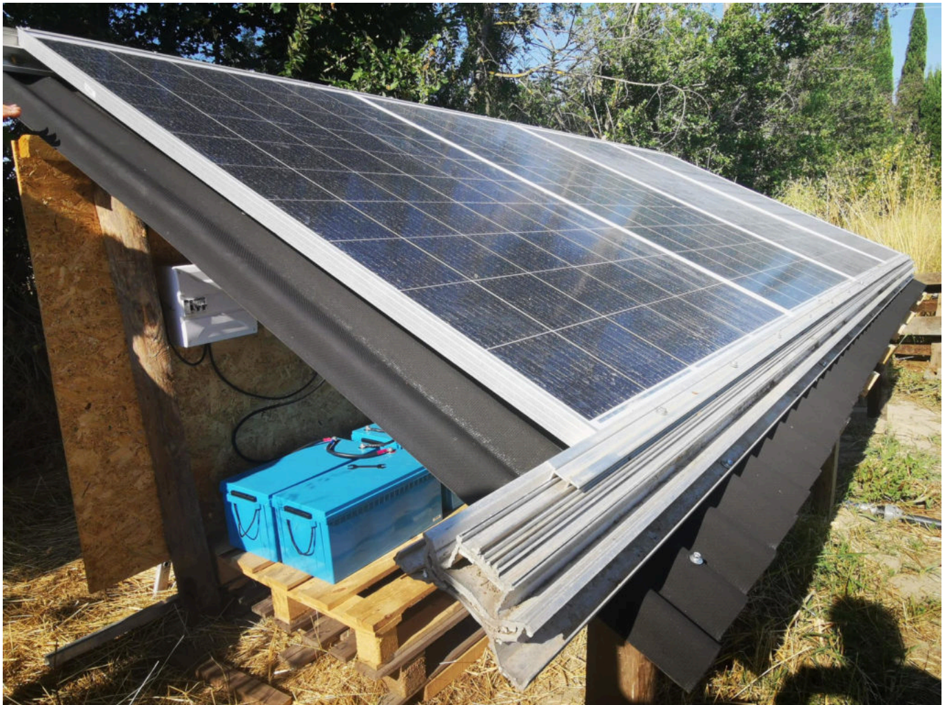
Les panneaux ont de beaux jours devant eux.

Les maîtres-mots ? Autosuffisance, équilibre des ressources et communion avec la nature. L'endroit est ressourçant, comme dit le proprio, « la terre est la seule chose qui permet de faire travailler en même temps le corps, le cœur et l'esprit. » Quand Damien potage, les préoccupations du quotidien s'envolent, la légèreté l'envahit et le meilleur des traitements prend effet. « On fait le choix de mettre soit du déchet vert, du foin, de la paille, du compost, de la fiente de mouton, tout ce qui est matière organique. On laisse faire la nature, les bactéries et champignons pour aboutir ainsi à un cercle vertueux. 'Nature never sleep', si l'on traite bien la nature, elle nous rend la pareille », philosophe l'hôte de ces lieux.