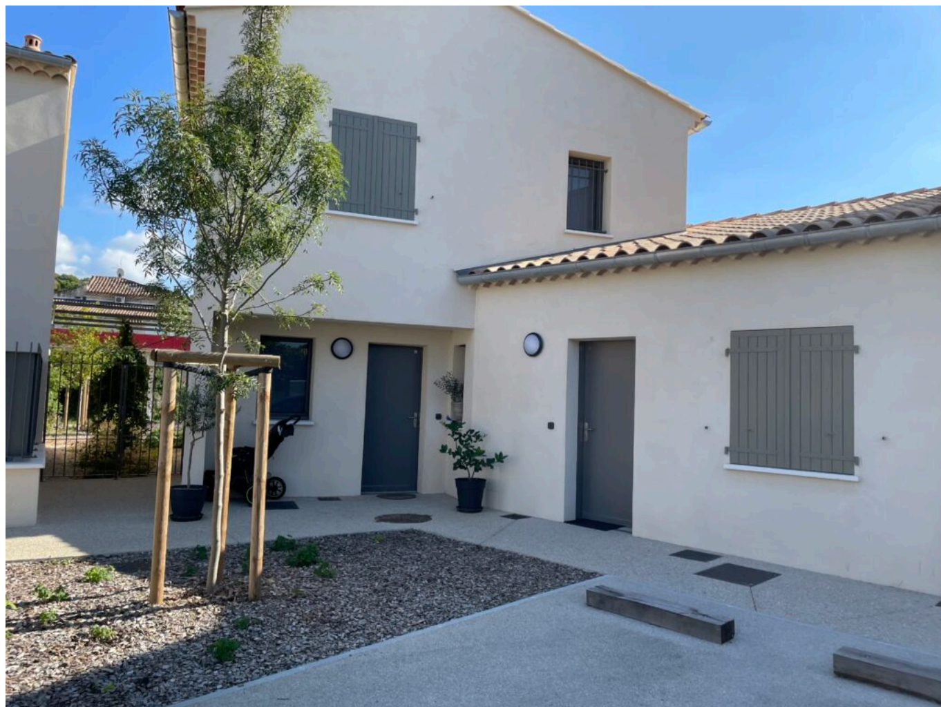
Les Eglantines à Pernes-les-Fontaines, programme de 11 villas, T3 en plain pied et T4 en duplex, Plus de 2,5M€ HT.

À travers ces visites, Grand Delta Habitat défend une vision claire : le logement n'est pas un produit, c'est un service public de proximité, un levier social, environnemental et territorial. « Ce qu'on dit à nos locataires, c'est finalement : bienvenue chez vous – même si c'est chez nous. » L'ensemble du programme visité ici .