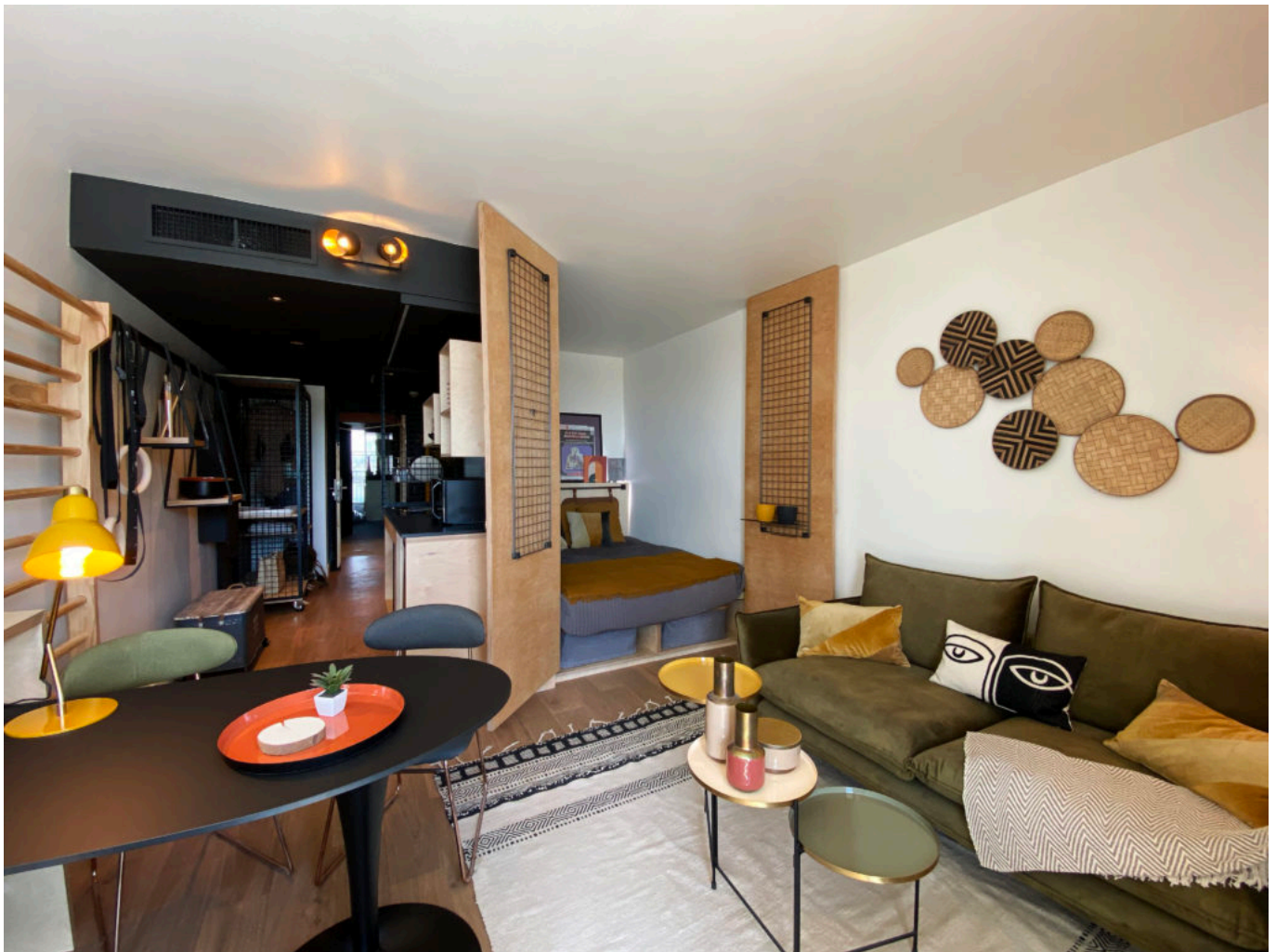
Un 'Flex appart' dans toute sa splendeur.

A l'intérieur du 'flex appart', notre œil se plaît dans ce design contemporain et chaleureux, cette bulle de vie ultra fonctionnelle et cosy. Le tarif est quant à lui dégressif. 720 euros TTC par mois (de 1 à 3 mois), 690 euros par mois (de 3 à 6 mois), 650 euros par mois (au-delà de 6 mois). Le tarif comprend alors toutes les charges : eau, électricité, wifi, assurance habitation... Et surtout, l'accès à tous les services. « Lorsque l'on considère tous ces éléments mis bout à bout, Cowool propose un super rapport qualité/prix », juge Anne-Audrey Beraud.