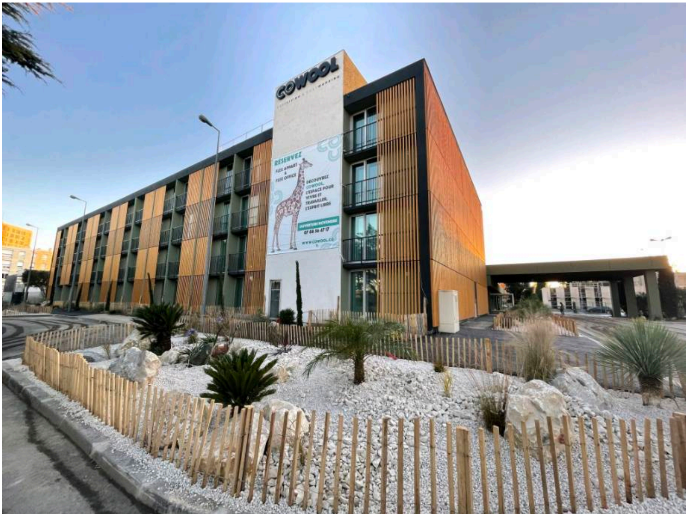
La girafe a pris ses quartiers 25 avenue de Mazarin.

Mention spéciale pour le studio audiovisuel équipé de fond vert, caméras, lumières, permettant de s'épanouir dans les projets audiovisuels. Nichés dans les 180m2 de l'espace restauration, deux frigos connectés proposent une offre salée et sucrée, locale et saine. Le plat du jour ? 6,50 euros. La fontaine à eau est gratuite, les 'Cowoolers' peuvent déposer leur Tupperware dans le frigo communautaire, faire couler un café dans la machine dernier cri et bientôt boire une bière au bar.