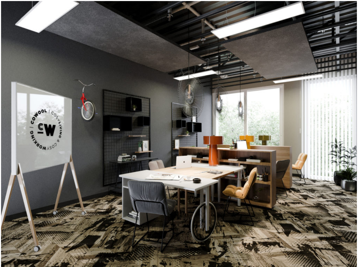
Un bureau signé Cowool.

Cerise sur le gâteau, des cabines individuelles dédiées aux appels téléphoniques fleurissent un peu partout dans l'open space. Jamais bien loin, des espaces ouverts et partagés pour se détendre, se réunir, se restaurer, travailler, collaborer, se concentrer... « Nous avons enrichi un maximum l'expérience avec les espaces partagés. C'est exceptionnel », se réjouit Anne-Audrey Beraud.