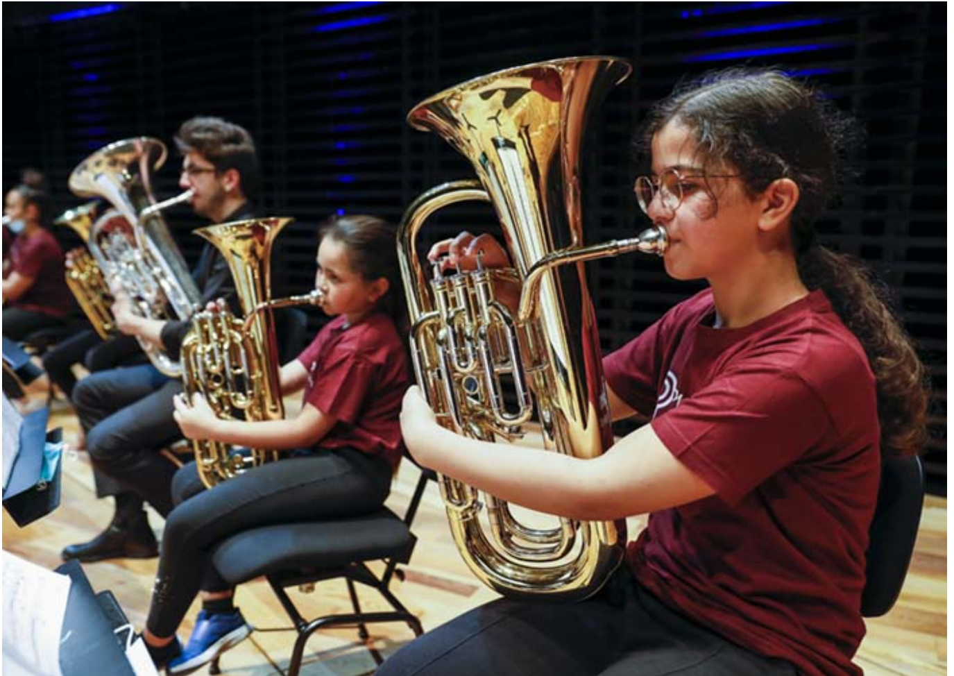
Projet Démon au Philharmonique Démon