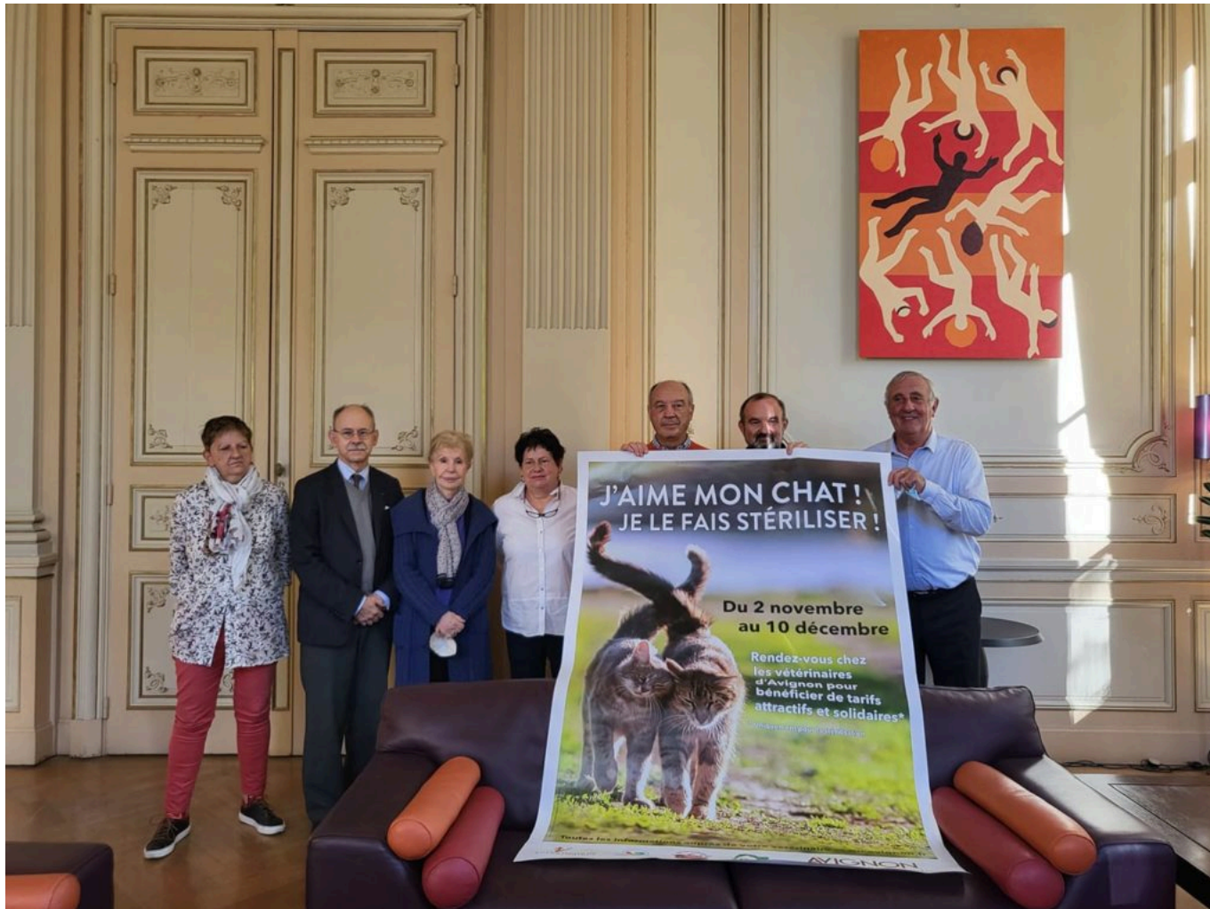
Annnonce de la campagne de stérilisation.