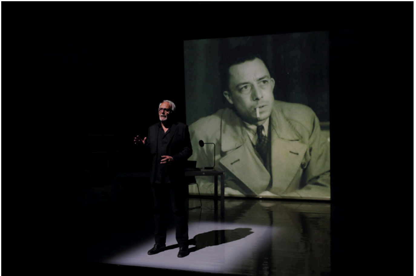
Didier Flamand incarne le texte Lettres à un ami Allemand d'Albert Camus.

Ce qui a forgé Albert Camus ? Une enfance marquée par l'absence d'un père, une mère sourde qui lit sur les lèvres mais est analphabète, la pauvreté, les copains de la rue. Plus tard ? Son incompréhension et son refus de la ségrégation entre français et arabes, son amour du foot, la découverte de la littérature, de la politique, du militantisme, l'absurdité de la guerre, le dépassement des passions et la dangerosité des idéologies. Enfin ? La découverte que l'autre est soi, que l'intelligence et le courage ne sont rien l'un sans l'autre, que le dépassement et l'accès à la lucidité se font aussi par la lecture, l'écriture, le théâtre populaire, et l'art.