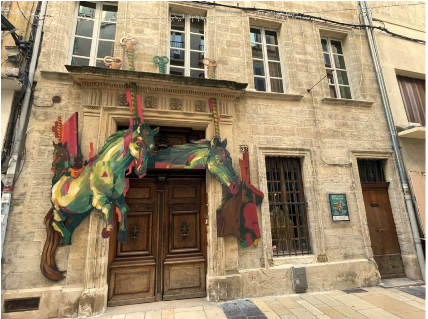
La façade de la Maison de la Maison de Fogasses