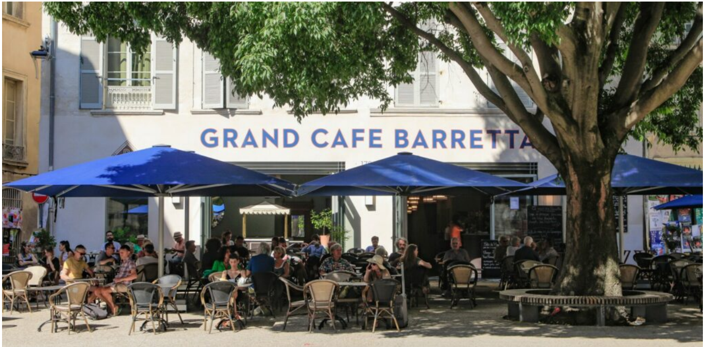
Le Grand Café Barretta à Avignon.

établissements/km 2 ), Aix-en-Provence (7 e avec 651 établissements/km 2 ) et Nice (8 e avec 602 établissements/km 2 ). Le grand Sud est largement représenté puisque Bordeaux (5 e avec 683 établissements/km 2 ), Bayonne (6 e avec 682 établissements/km 2 ) ainsi que Montpellier (9 e avec 590 établissements/km 2 ) figurent dans ce top 10. Seules les villes d'Annecy (3 e avec 738 établissements/km 2 ) et Rennes (10 e avec 541 établissements/km 2 ) troublent ce presque grand schémisme sudiste.