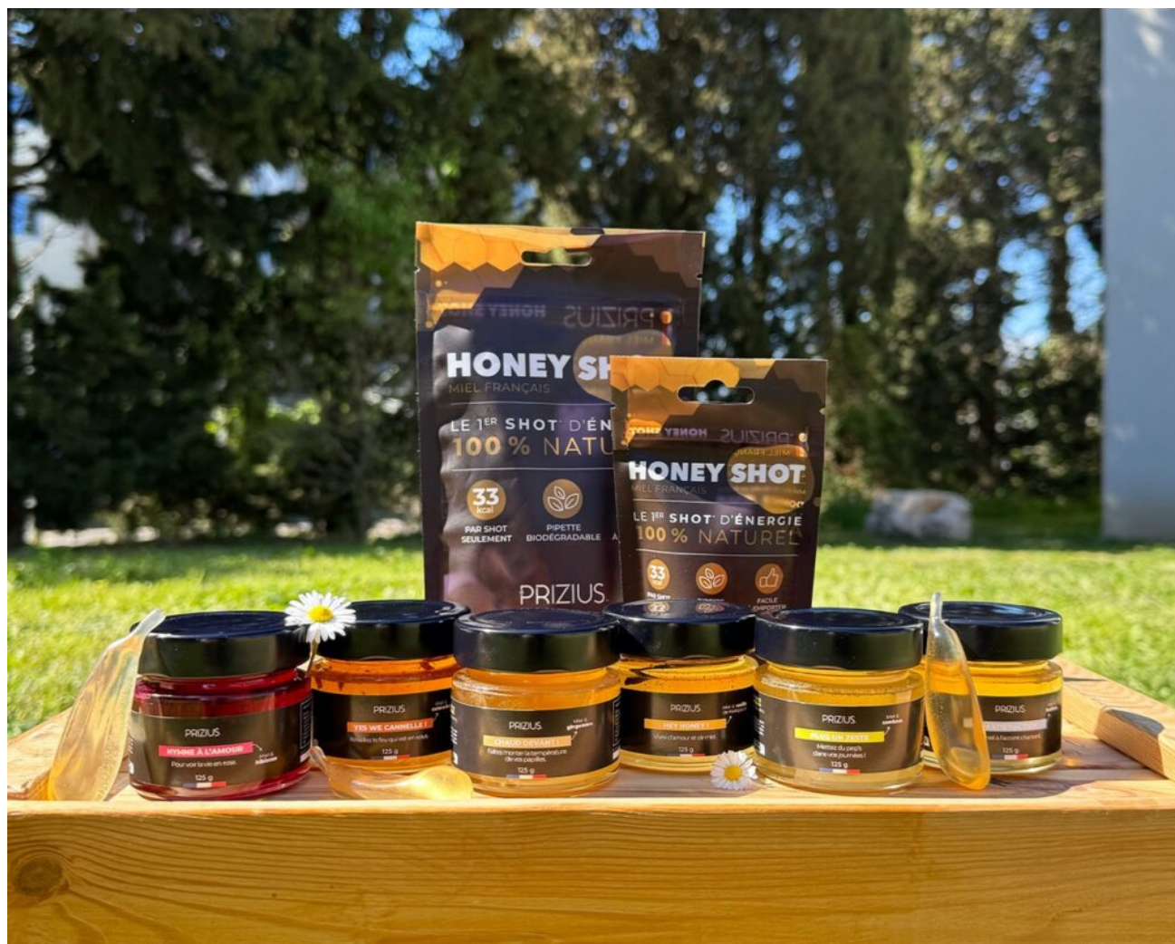
Les miels et capsules HoneyShot.