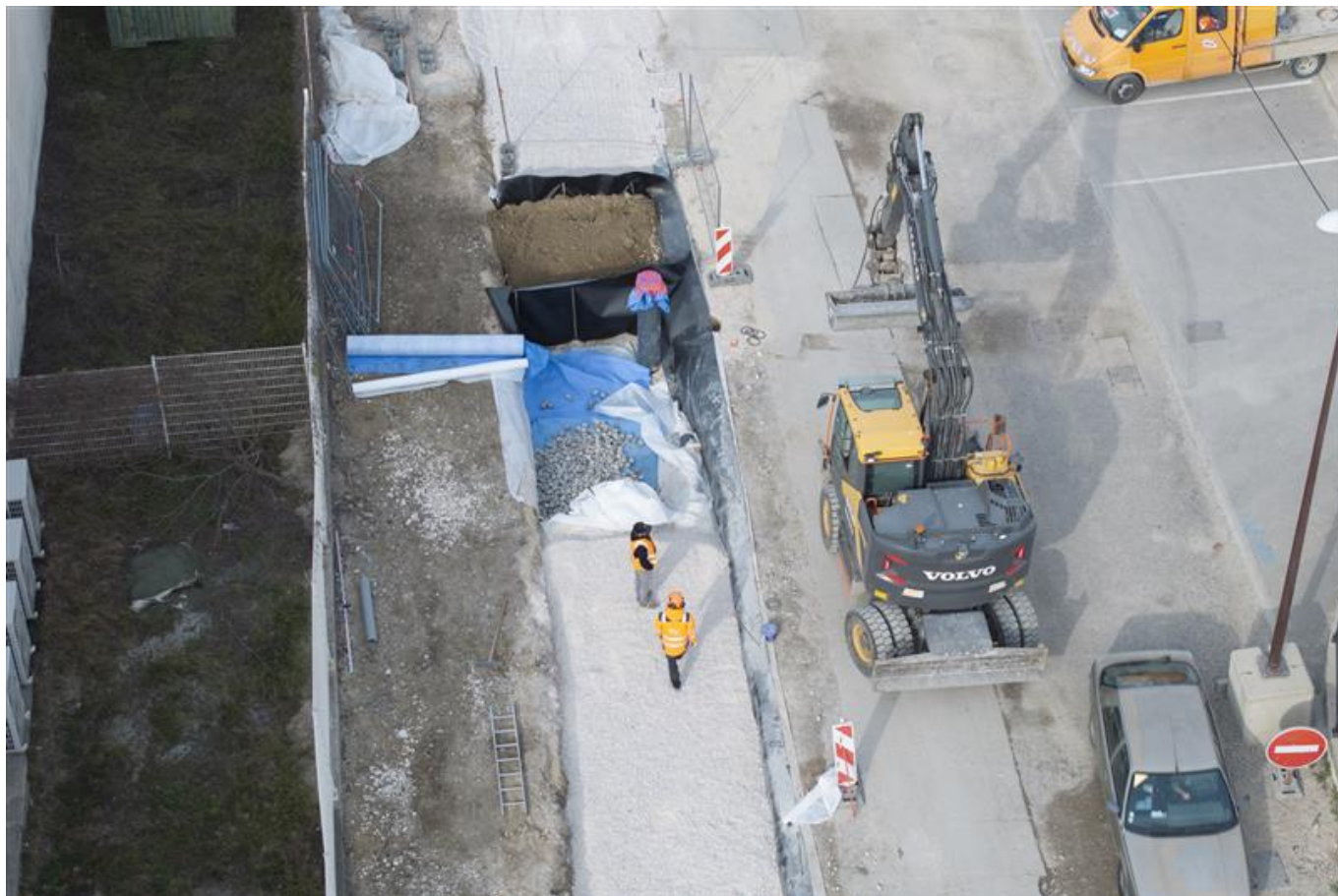
l'Orme Fourchu