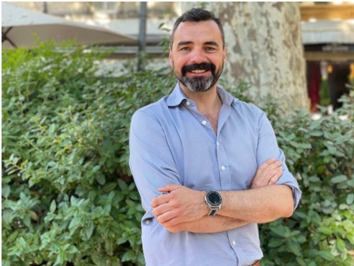
Paul-Roger Gontard Copyright MMH