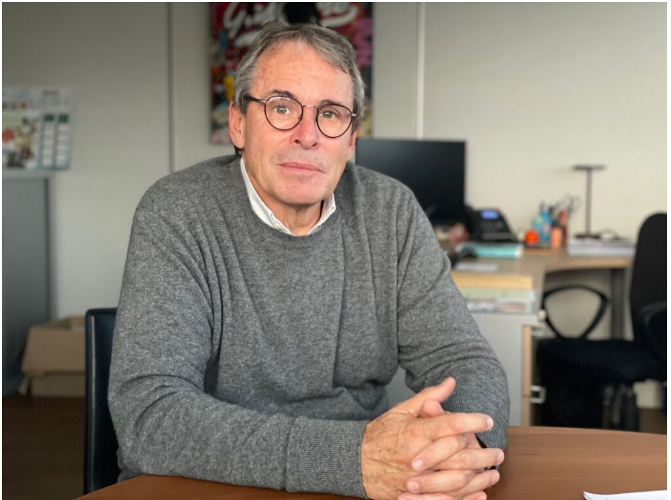
Eric Dupressoire Copyright MMH