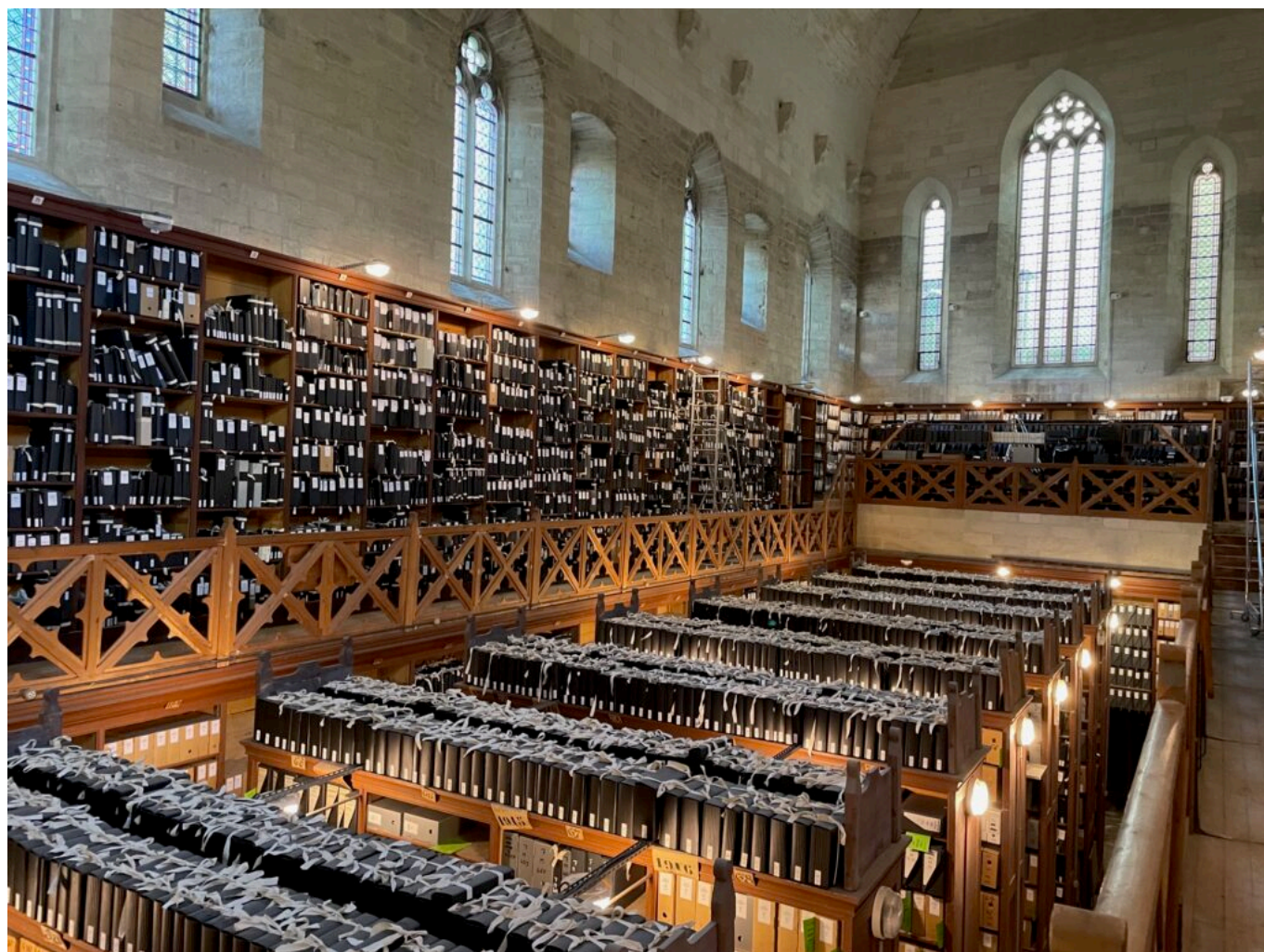
La Chapelle Benoit XII

Depuis 2017, dans un silence méticuleux, des mains expertes répertorient, dépoussièrent, conditionnent. Boîte après boîte, chaque document est préparé pour le grand voyage. Des parchemins médiévaux aux archives foncières les plus récentes, rien n'est laissé au hasard. Les fameuses « Jeannettes », armoires roulantes fabriquées sur mesure, sillonnent désormais les allées du palais, chargées de mémoire et d'histoire. Elles glissent dans les couloirs comme des vaisseaux transportant l'essence du passé, direction : Memento .