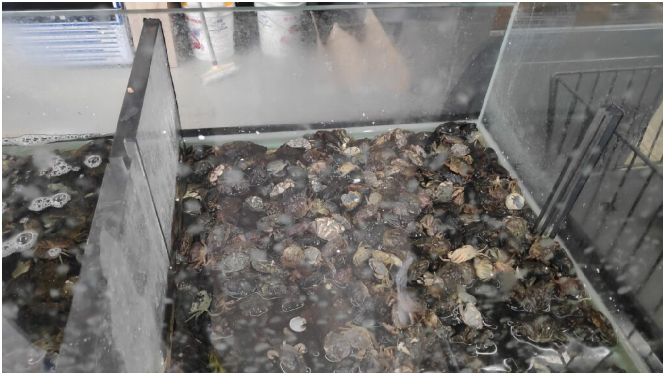
Vente de crabes pour la pêche en mer

«Bien sûr que cela nous révolte. mais nous ne travaillons pas du tout sur l'abattage des animaux -je suis moi même végétarienne-. Notre expertise reste la lutte en faveur des animaux exploités dans le loisir, le divertissement et la cohabitation pacifique avec les animaux liminaires. Cependant nous militons pour qu'il n'y ait pas de dérogations à la Loi. L'absence t'étourdissement pour des questions rituelles cascher ou halal est une exception à la Loi qui prévoit que lorsque l'on veut abattre un animal pour le manger, il doit être en théorie, inconscient. En effet, cette dérogation à la Loi est donc un scandale et il ne devrait pas y en avoir au regard de la protection animale.»