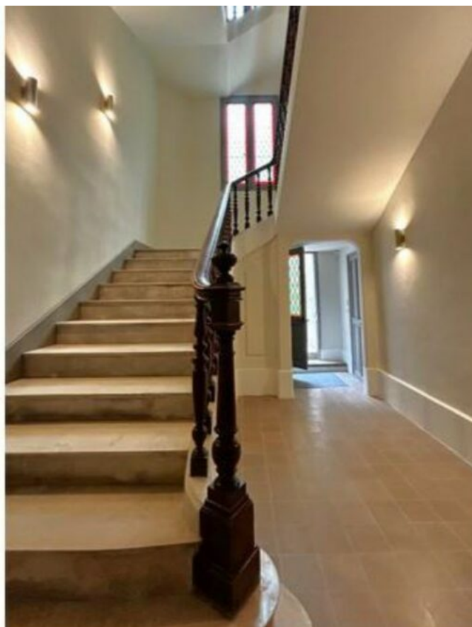
Réhabilitation 6, rue du Roi René à Avignon