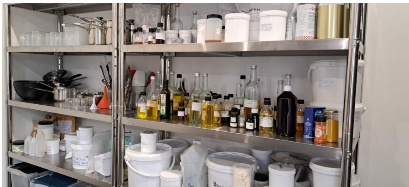
L'atelier-laboratoire de l'ECBF.